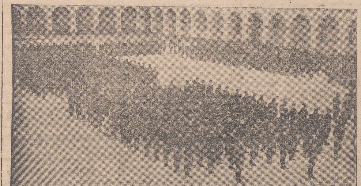
TERMINADA LA MISA, LAS FUERZAS SE DISPONEN A DESFILAR ANTE LAS AUTORIDADES.