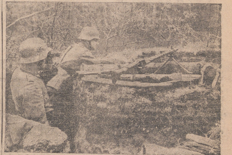
Con estos puestos avanzados exponen los soldados alemanes la primera resistencia a los ataques lanzados por los soviets.