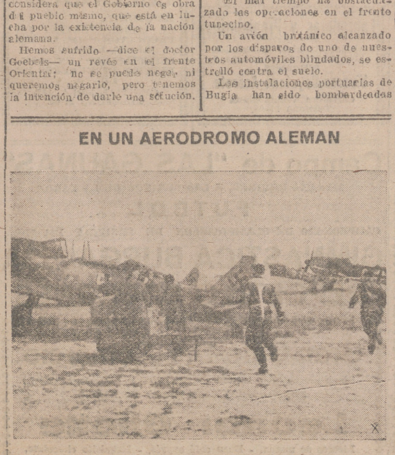
Se ha dado su alarma. Los pilotos de caza alemanes corren a sus aviones. En breve tiempo, los F. W. 190 partirán contra el adversario.