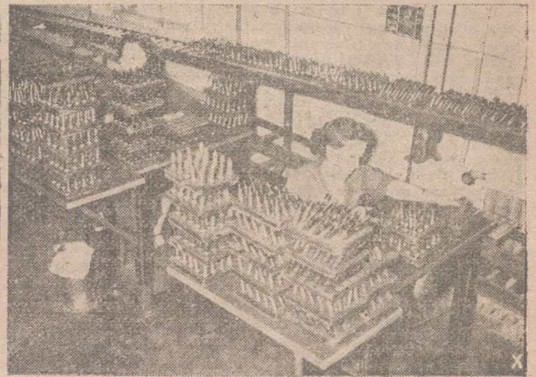
Mujeres alemanas cooperan, en las fábricas de municiones, al logro de las medidas adoptadas por el Gobierno del Reich para llegar a la guerra total