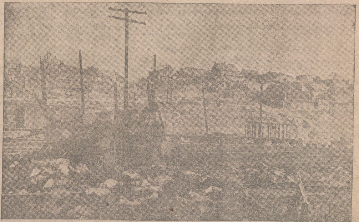
A este estado fueron reducidas las vías férreas de Stalingrado por los “Stukas” antes de su ocupación por las tropas alemanas.