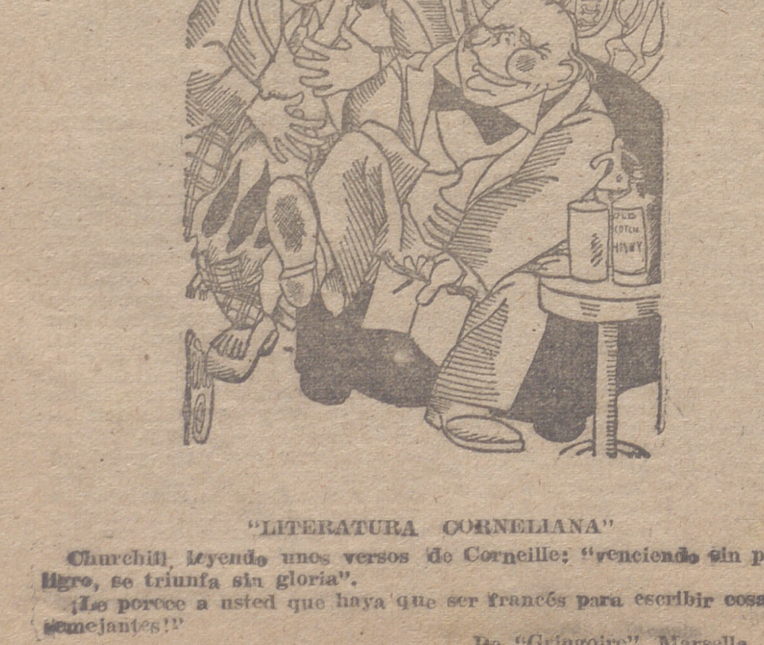
"LITERATURA CORNELIANA" Churchill leyendo unos versos de Corneille: "venciendo sin peñero, se triunfa sin gloria..."