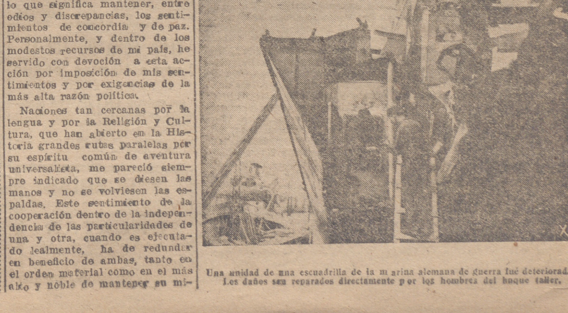
Una unidad de una escuadrilla de la marina alemana de guerra fué deteriorada. Los daños son reparados directamente por los hombres del buque taller.

"El jefe encarna la gloria militar y heroica de sus soldados. En el teniente general Muñoz Grandes se sintetiza, pues, el valor y el denuedo de los voluntarios falangistas que luchan en las fronteras de Europa contra el comunismo. Y siendo la Palma de Plata la más preciosa distinción que la Falange otorga a los actos de sacrificio heroico,