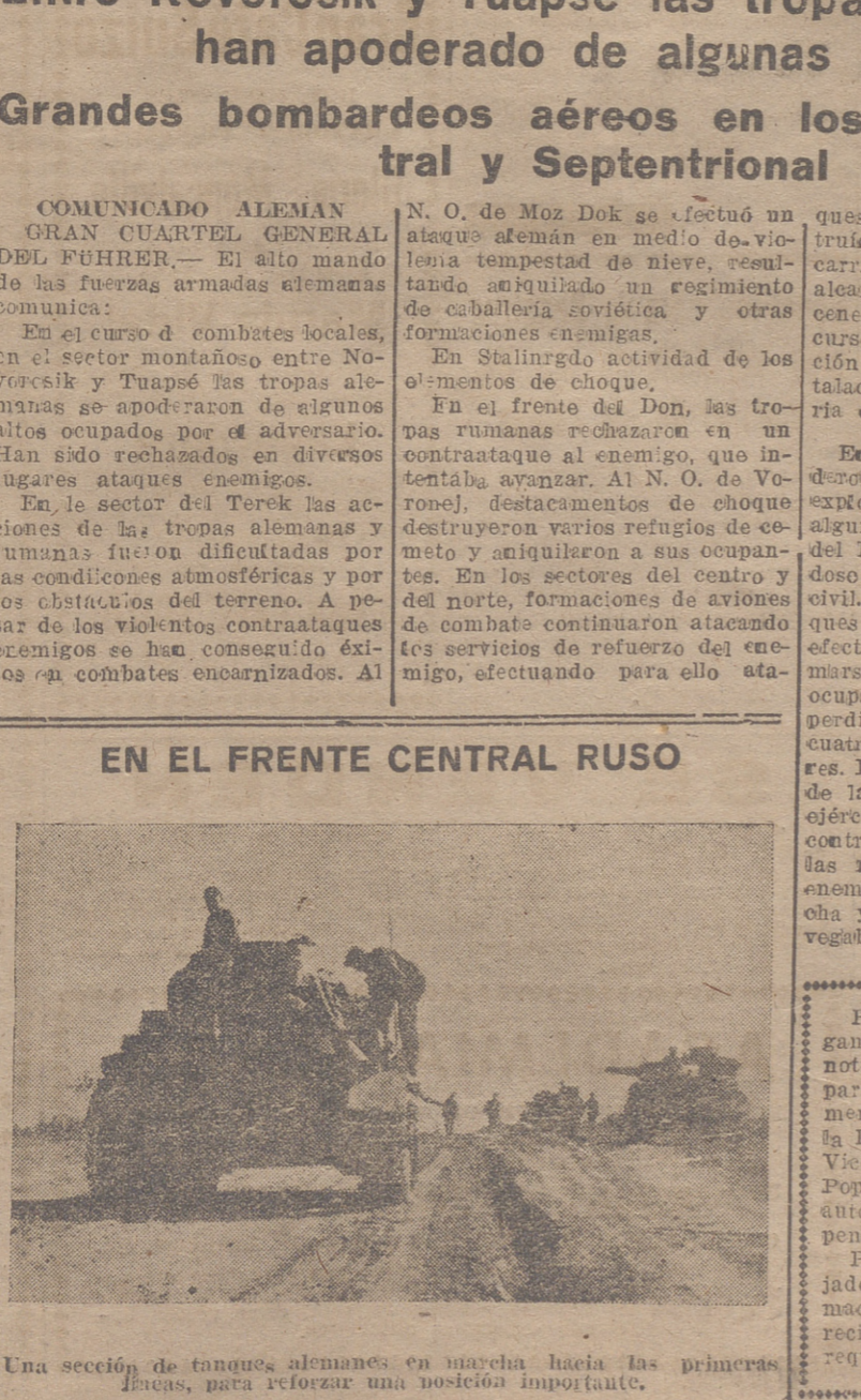
Una sección de tanques alemanes en marcha hacia las primeras líneas, para reforzar una posición importante.