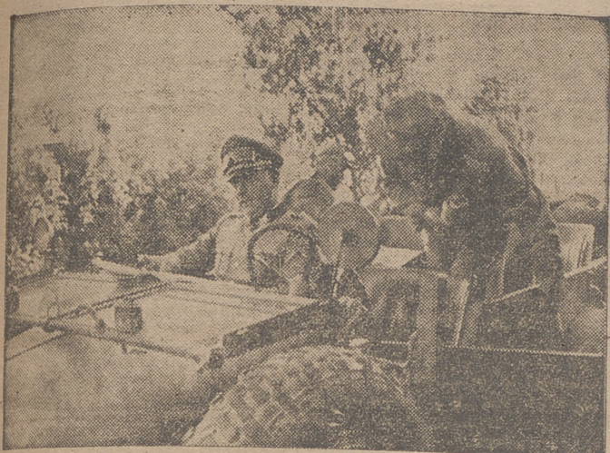
COMANDANTE ALEMAN, EN EL SECTOR DEL CAUCASO, VA CON SU COCHE A LAS DIFERENTES DIVISIONES ALEMANAS PARA DARLES LAS ORDENES CONVENIENTES DE ATAQUE.