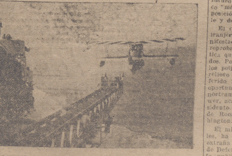
HIPOAVION LANZADO POR LA CATAPULTA DE UN CRUCERO PARA UN VUELO DE RECONOCIMIENTO.