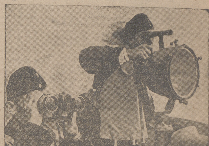
MIENTRAS UNO DE LOS MARINOS LEE LAS SEÑALES QUE RECIBE DE OTRO BARCO, EL OTRO HACE ASIMISMO TAMBIEN LAS SEÑALES DE CONTESTACION AL OTRO BARCO.