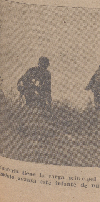
La infantería tiene la carga principal en los combates. Cuidadosamente avanza este infante de nuestra foto por la zanja.

Con el explicativo resumen que hemos hecho de la reciente Orden, queda plenamente demostrada su trascendencia para la economía nacional, trascendencia que obliga al consumidor a colaborar con la oficina de inspección para hacer imposible la vulneración de las normas.