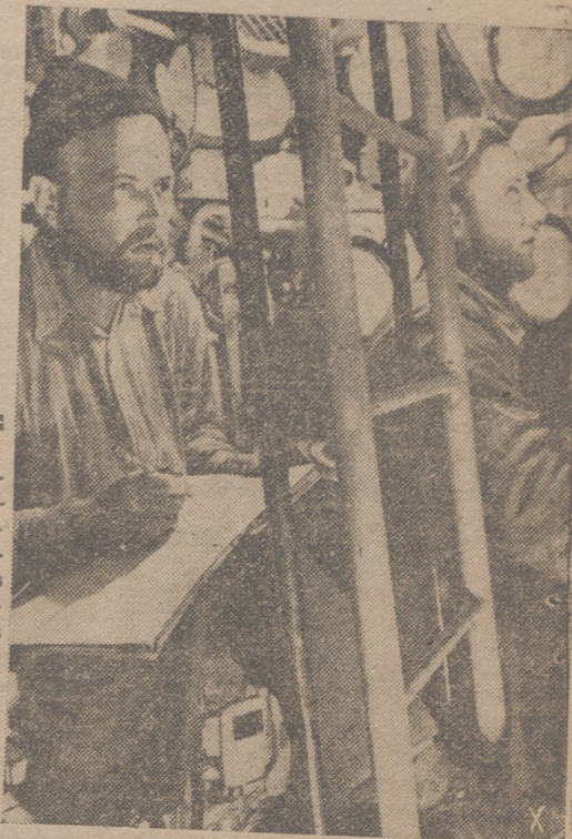
Durante el ataque a una unidad de superficie, todos permanecen con los nervios en tensión, como nos muestran estos marineros de un submarino alemán