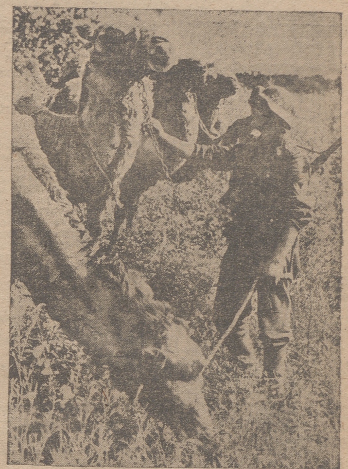
Para avanzar por las regiones del Sur ruso, próximas al Cáucaso, los cazadores alpinos alemanos usan los drómédarios encontrados en el país, utilizándolos para salvar terrenos difíciles.

VILLKIE EN CHINA CHUNGKING. — Ha llegado a esta capital, procedente de la Unión Soviética, Wendell Willkie. (Efe.) CHUNGKING. — Wendell Willkie permanecerá unas dos semanas en China, ha declarado el portavoz gubernamental. Añadió que todos los informes que solicite el enviado especial de Roosevelt le serán facilitados por las autoridades chinas. (Efe.)