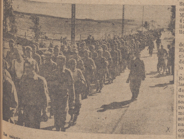
La columna de soldados ingleses capturados en Dieppe marchan al campo de concentración donde serán internados hasta el fin de la guerra.