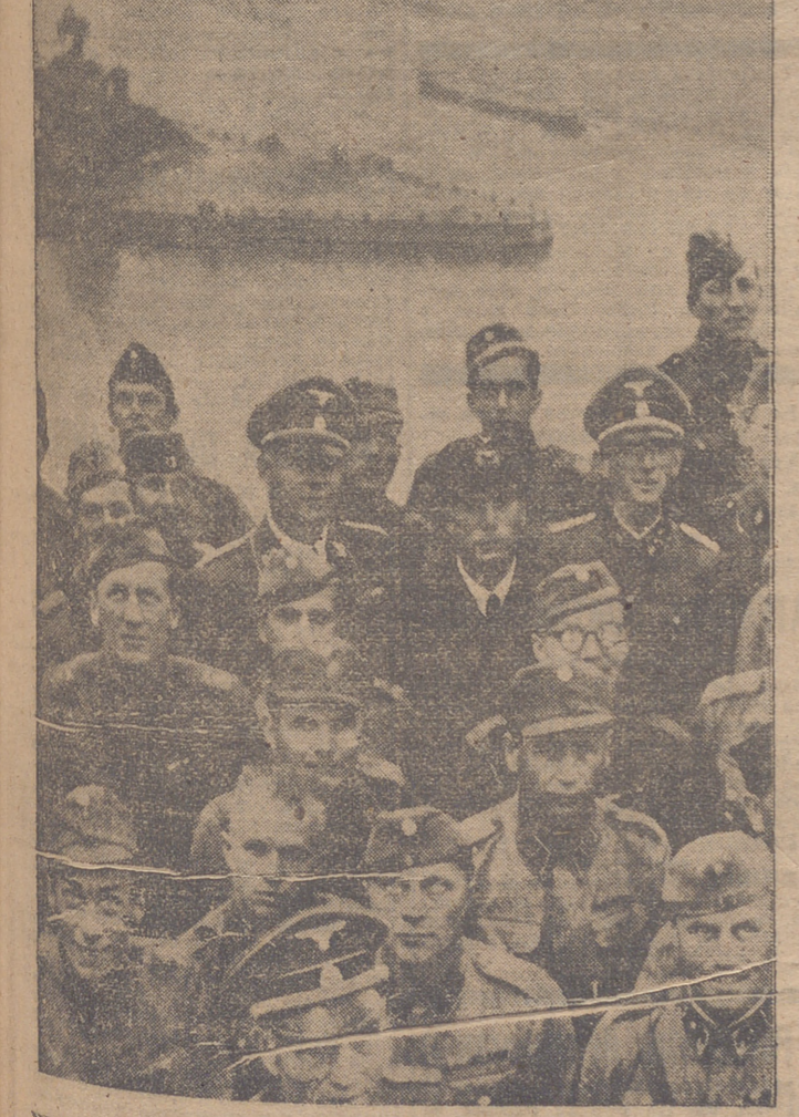
HERIDOS FINLANDESES HAN SIDO INVITADOS POR EL JEFE DE LA S. S. ALEMANA A UN VIAJE DE RECREO POR ALEMANIA. LA FOTOGRAFIA MUESTRA UN GRUPO DE ESTOS HERIDOS DURANTE SU ESTANCIA EN KOBLENZA.