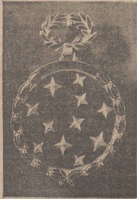
ME-DALLA DE LA VIEJA GUARDIA DE F. E. T. Y DE LAS JONS

La primera medalla fué impuesta por el Jefe Nacional de la Falange, simbólicamente, al Fundador