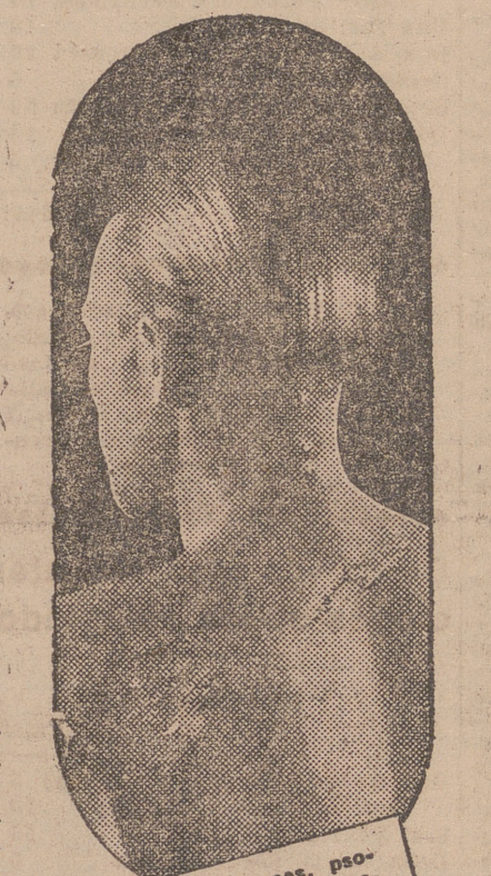
El eczema, herpes, psoriasis, etc., son manifestaciones de una sangre viciada que se debe purificar con el DEPURATIVO RICHELET

El Depurativo Richelet, es más que nada el "rectificador" por excelencia de la sangre viciada, ya que bajo su acción la masa sanguínea se purifica completamente. La sangre vuelve a