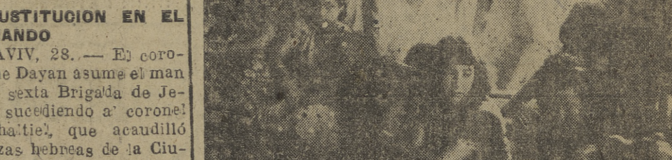
Ya ha llegado a España el "Monte Albertia", trayendo a las camaradas de Coros y Danzas de la Sección Femenina, un grupo de las cuales aparece en la "foto", cuando acudió a cumplimentar a su delegada nacional, Pilar Primo de Rivera, para hablar de esas cosas que no se cuentan en la jira tricolor por olvido o por emoción. De todos los detalles de una jira tricolor, extraordinaria, a la tierra hispanica de América y Portugal, en una embajada sin más credenciales que la música trenzada y destrenzada por pies menudos e incansables y la gracia pura, limpia, de jóvenes sonrisas, sin cansa, sin dejar de sonreír y sin cambiar su condición de escudristas por la importancia de embajadoras universales de la Patria entera.

HAITI, EN MANOS DE LAS NACIONES UNIDAS Las Naciones Unidas se harán cargo de los tres millones y medio de habitantes de Haití y enviarán expertos en distintos campos de actividad para desarrollar el programa de rehabilitación. Este programa se iniciará en octubre. — En Haití existen depósitos de oro, maderas de caoba, café, algodón, azúcar y otros productos. El paludismo azota constantemente la vida de los indígenas. (Efe.) HONGKONG, 28. — Durante la noche se ha dejado sentir el primer tifón de la temporada, que ha destruido casas y barcos. Una ola con velocidad de más de 100 kilómetros por hora y fuertes vientos han azotado la isla de Cheung Chau. Cincuenta juncos se han hundido. Se teme que haya habido gran número de muertos. — VICTIMAS DE LAS INUNDACIONES TOKIO, 28. — Sesenta y tres personas han perecido ahogadas y sesenta y ocho han resultado heridas a consecuencia de las inundaciones de la región de Fukui, donde tres mil personas resultaron muertas después de un tifón de tierra ocurrido el pasado mes. (Efe.)