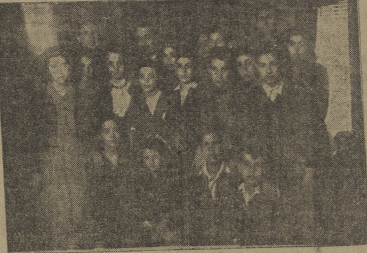
El gobernador civil de la provincia, don Alejandro Rodríguez de Valcárcel, rodeado de los alumnos de las escuelas municipales donostiarres, durante la visita que éstos hicieron a nuestra primera autoridad, después de la cual fueron recibidos por nuestro prelado en el palacio arzobispal. (Foto Villafranca.)

TOLEDO, 19. — Ha causado gran satisfacción la noticia de que la Academia de Infantería volverá a Toledo en el próximo curso. (Cifra.)