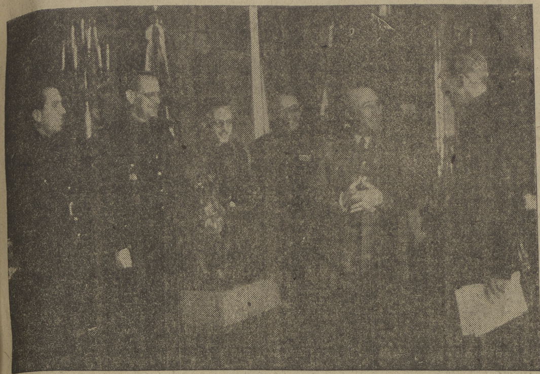
Su Excelencia el Jefe del Estado hace entrega a las Jefaturas Provinciales del Frente de Juventudes de Madrid y Santander del trofeo y guión de su nombre.