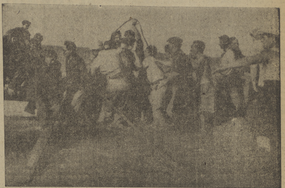
El fotógrafo pudo captar esta escena en Naharia, pueblito costero al N. de Haifa, donde desembarcaron clandestinamente, totalmente extenuados, 600 Judíos del buque, "United Nations".