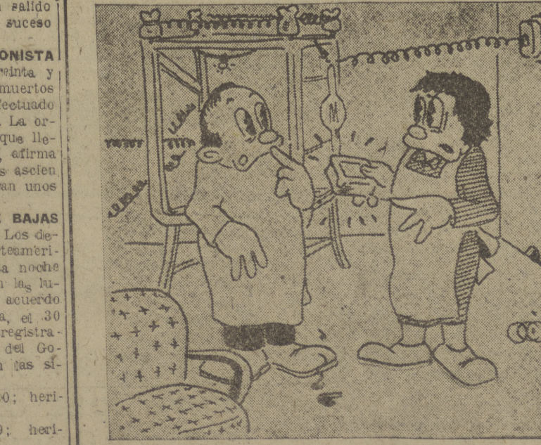
—Vea usted esta lata por Bayos, señor. Antes de comprarla, la señora quiere cerciorarse de que están las seis sardinas dentro... (Cifra).