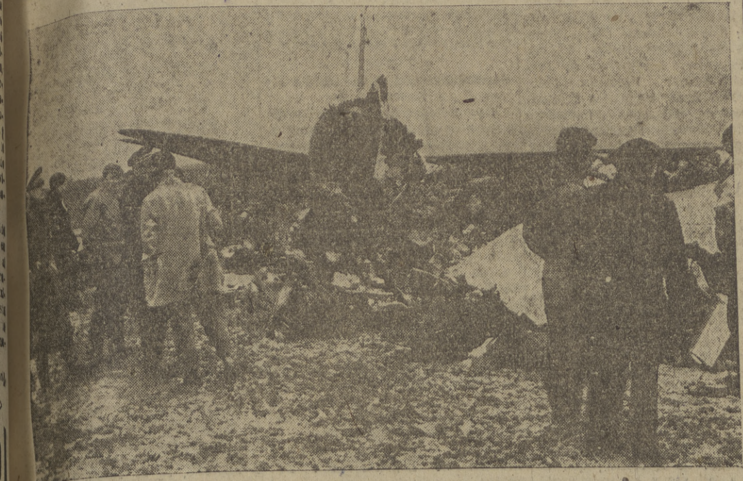
Estado en que quedó el avión de pasajeros que hacía el servicio entre Bruselas y París y que se incendió cuando intentaba despegar del aeródromo de Borgat, resultando 15 viajeros muertos.