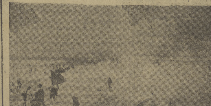
Nadie diría que en una playa hiciera falta regar. Pues bien, en Río de Janeiro son tan optimistas, que han puesto en servicio un camión-ouba que extrae agua del mar y la proyecta con fuerza regando generosamente la caliente arena y... duchando a los bañistas, como si a la mar se fuera "por naranjas"

Por su parte, un portavoz oficial del Gobierno británico critica al de Yugoslavia por la forma desoverta en que ha presentado sus reclamaciones sobre supuestos incidentes fronterizos en Verneola Julia, y afirma que la versión yugoslava de tales incidentes