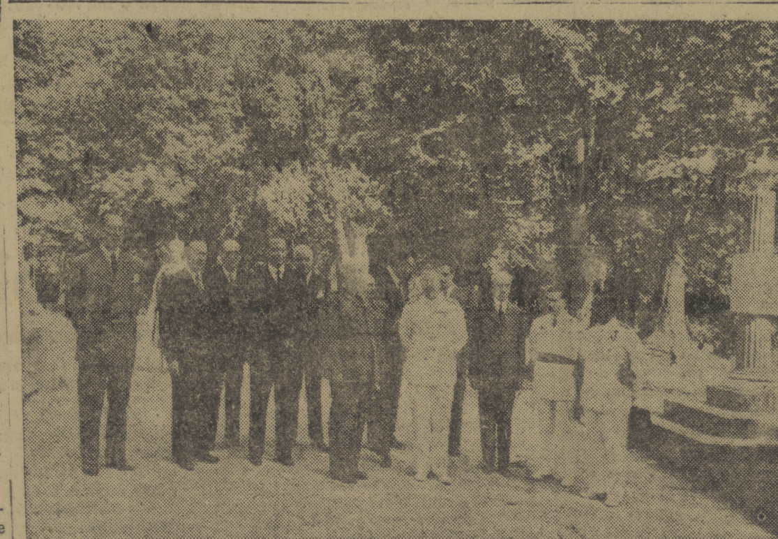
Estos son los hombres que, bajo la capitania de Franco, rigen los poderes de España, en la plena armonía de un Estado suficientemente fuerte para emprender altas empresas. Tras ellos, el pueblo español, dispuesto al sacrificio y a la disciplina