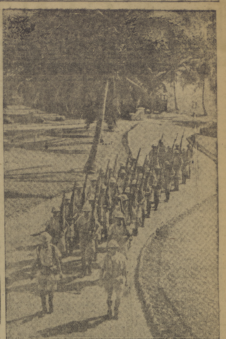
Palestina vive horas de angustia. A la sombra de las sinagogas, el Ejército Inglés levanta defensas y tiende alambradas. En la fotografía, una sección de tropas de choque desfila por el parque de Sión

primeras horas de la tarde luce el sol y el tiempo parece asegurarse.—Cifra. LA CORUÑA, 18. — S. E. el jefe del Estado y Generalísimo de los Ejércitos nacionales, ha llegado esta tarde a La Coruña, en el crucero "Galicia". La Coruña ha vivido hoy una jornada indescriptible de fervor y emoción. Una vez más, la capital de la provincia natal del Caudillo, ha tributado a S. E. un homenaje de fe, adhesión y afecto, al que se sumó el pueblo en masa. A La Coruña habían llegado (Pasa a última página).