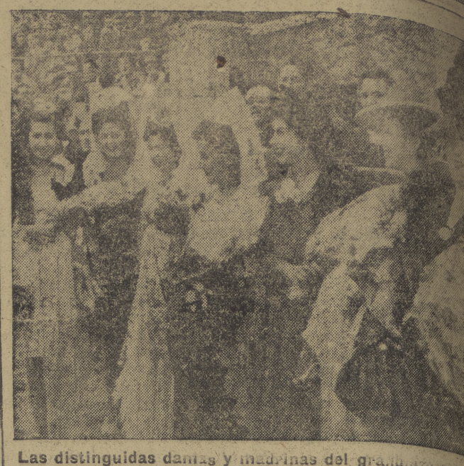
Las distinguidas damas y niñas del gran espectáculo verificado en la tarde del domingo en la Plaza de Toros, organizado por los periodistas burgaleses.