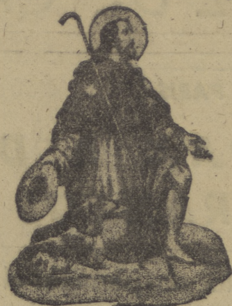
San Roque, patrón de Pradoluengo

Además los gaiteros de Villabuena, que traen variado repertorio y acompañarán a