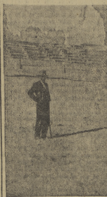
¡El mayoral! ¡Ya están los toros! Un detalle simpático de las fiestas este del mayoral paseado por las calles y que luego se deja retratar en el redondel.

En la Secretaría del Ayuntamiento se han efectuado refor-