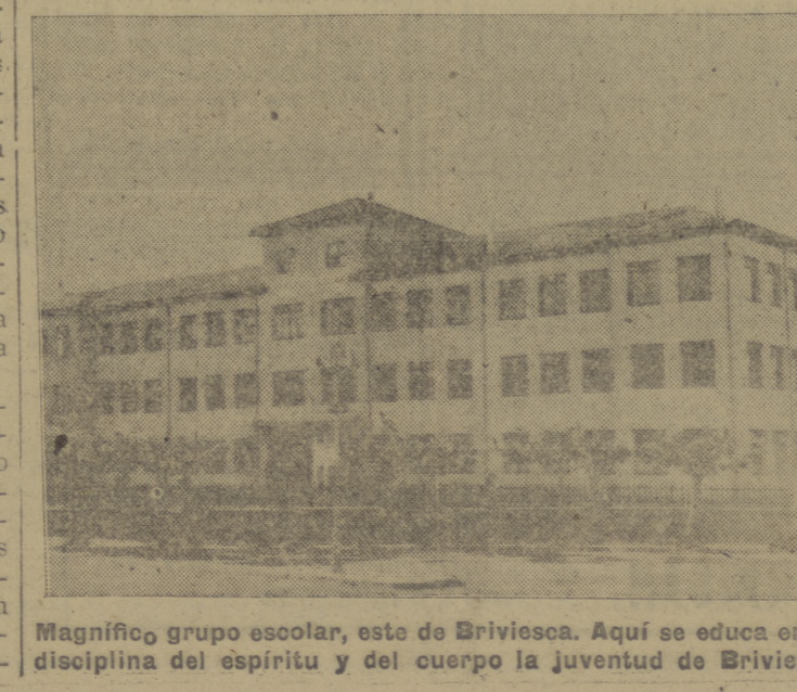
Magnífico grupo escolar, esto de Briviesca. Aquí se educa en la disciplina del espíritu y del cuerpo la juventud de Briviesca.

CON TRES MIL PESETAS 3.334. — Barcelona, A i calí de Guadaira, Córdoba, Valencia, Málaga, Bilbao.