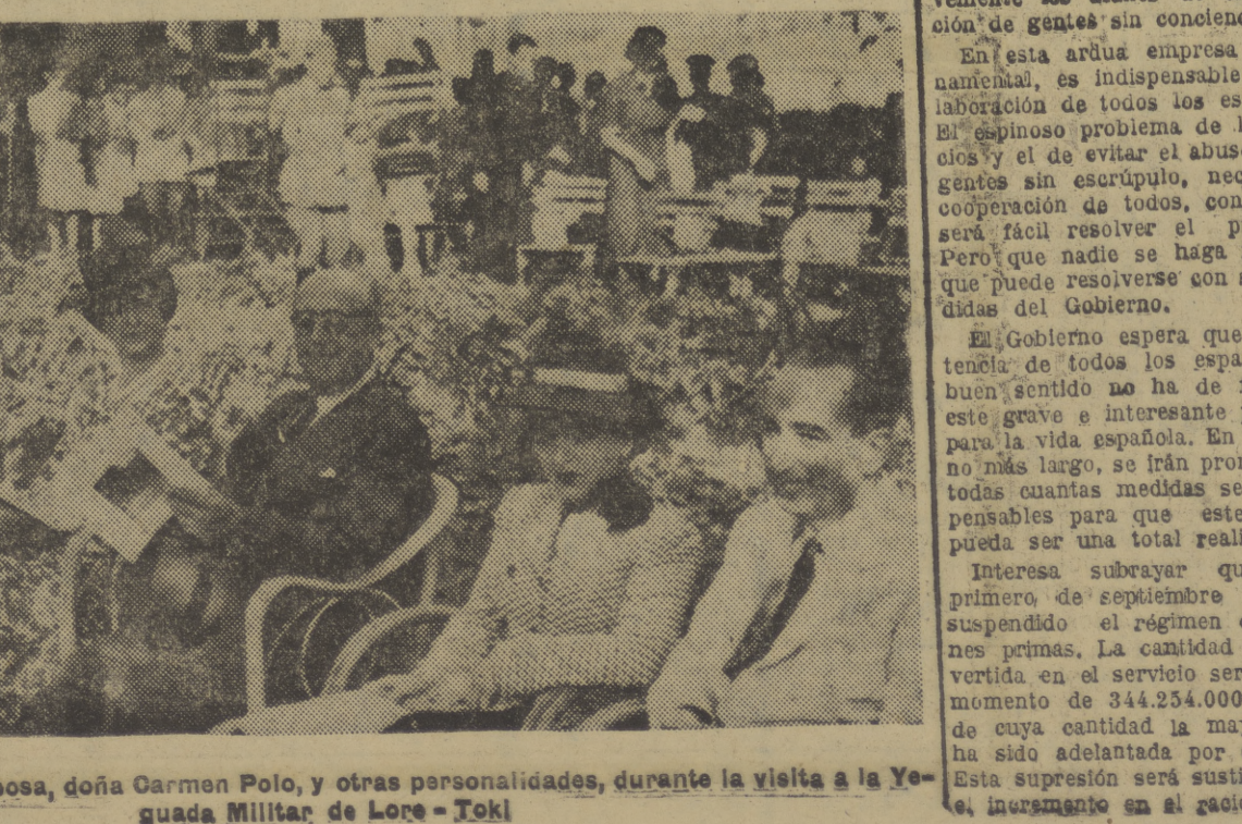
El Caudillo, con su esposa, doña Carmen Polo, y otras personalidades, durante la visita a la Yaguardo Militar de Lore-Tokl