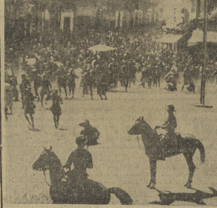
Un aspecto de la principal avenida de Jerusalén, en el momento en que la Policía británica carga contra manifestantes judíos