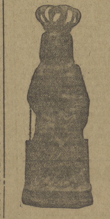
Salas de Bureba. Imagen de Nuestra Señora de la Oliva, del siglo XIV.

La Delegación provincial del Frente de Juventudes y el laudado Orfeón Burgalés, que con tesón admirable y digno de los mayores elogios han trabajado en estos últimos años por restaurar las danzas regionales de Castilla, llevando a las plazas y a los escenarios un magnífico Cuadro artístico que con su ameno repertorio de "Estampas castellanas" ha merecido los más calurosos aplausos en las principales ciudades de España, y todos los burgaleses tienen una ocasión magnífica de presenciar, ahora la ejecución de típicas danzas populares, que no fueron exhibidas en el concurso del Milenario de Castilla.