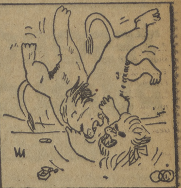
Que no Leo, que no! Te repito que ese pase de fox no será...

Cuba es hoy una nación completamente atestado de visitantes que vive la época dorada de su turismo. Se calcula que unos 3.000 visitantes llegan a la isla cada semana en los grandes aviones de la Panamericana. Esta afluencia semanal de turistas supone para la Hacienda cubana un ingreso de unos 20 millones de pesetas. La oficina de turismo calcula que los gastos de cada turista asciende a 5.000 pesetas. La reserva de habitaciones en los hoteles está limitada y la adquisición de una de ellas cuesta un verdadero triunfo. Las escasas habitaciones disponibles en los hoteles están siempre llenas y una cola de peticionarios que utilizan para sus fines las más variadas recomendaciones esperan el momento en que la salida de cualquier turista les deje libre un hueco donde poder acomodarse. Las autoridades realizan grandes esfuerzos para tratar de resolver este problema de alojamiento, que a la larga amenaza con cortar el río de oro que diariamente entra en la isla, pero hasta ahora sus esfuerzos no han logrado ningún resultado práctico. El último intento para lograr amornar la crisis de hospedajes ha sido efectuado por las autoridades al convertir un sanatorio antituberculoso en un hotel de lujo. Esta falta de hoteles era en Cuba un grave problema en la antigüedad. Entonces los turistas lo solucionaban durmiendo en los mismos barcos en que hacían el viaje, anclados en el puerto. Hoy, en que el medio de transporte es casi exclusivamente el avión, no hay posibilidad de utilizarlo.