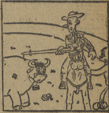
EL TORO. — ¡No juegas! Ese caballo va...