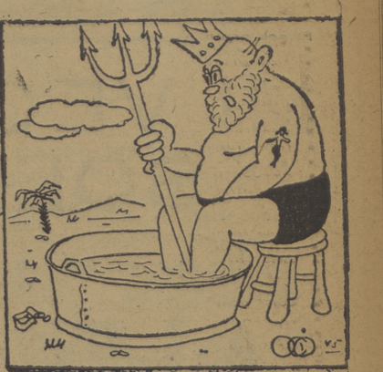
Neptuno:—A esto han quedado reducidos mis dominios después de la sequía...