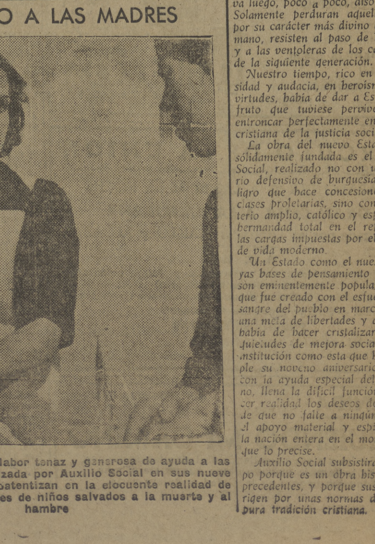
Los resultados de una labor tenaz y generosa de ayuda a las madres españolas...