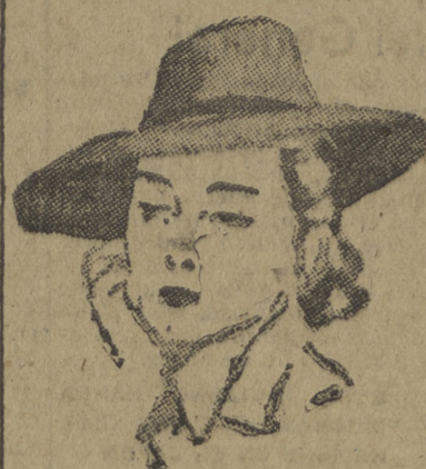
Doña Paz, protagonista del cuento.