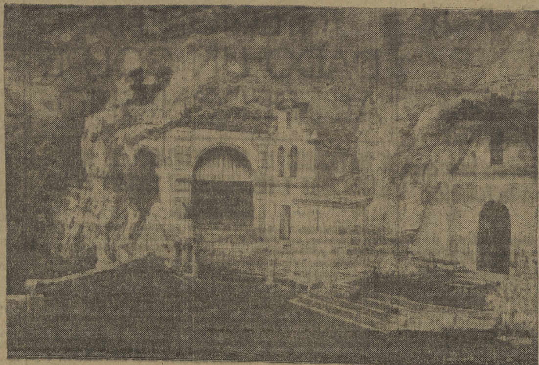
Vista del Santuario de San Bernabé.

El paraje se presta como pocos para evocar una grande empresa, y si no tiene la montaña la grandeza y misterio que la de Asturias con sus impenetrables bosques y lo imponente de sus cascadas, es en cambio más am-