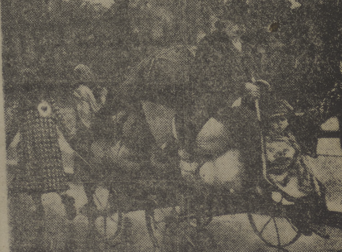
Familias de Judíos polacos se trasladan hacia los puertos donde embarcarán rumbo a Palestina.

EMIGRANTES JUDIOS Familias de Judíos polacos se trasladan hacia los puertos donde embarcarán rumbo a Palestina.