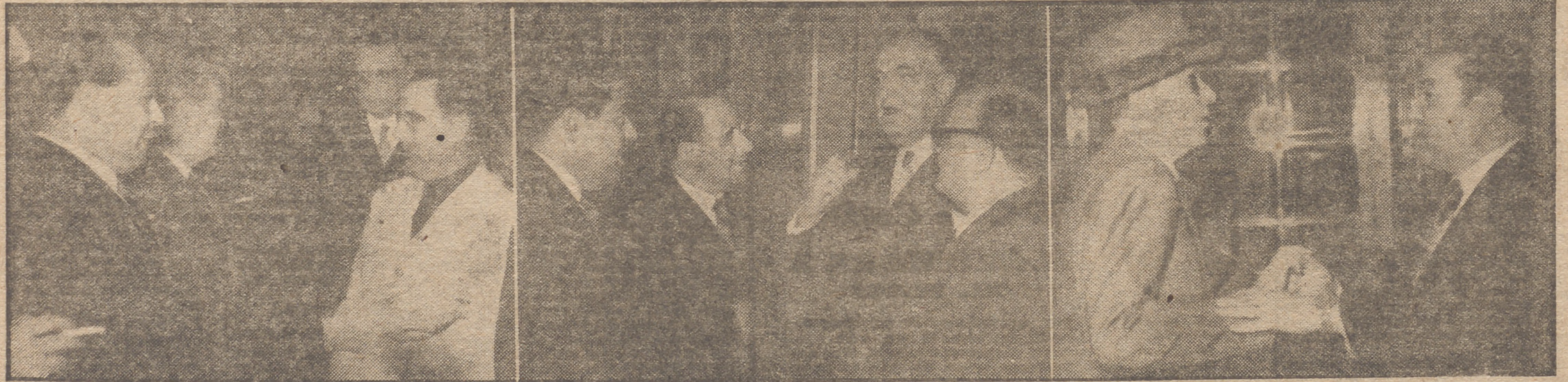
El "flash" sigue disparando en el Palacio de las Cortes Españolas: el Delegado Nacional de Sindicatos, señor Solís Ruiz, corresponde al saludo de otros procuradores sindicales; el ministro de Obras Públicas, conde de Vallellano, conversa afectuosamente con un grupo de periodistas, y el general Millán Astray, de paisano, saluda al dirigente social de los Transportes señor García Ribes en el momento de entrar en el palacio.

Elogió al Municipio, la Diputación y el Sindicato, y agregó que cuando la institución sindical llega a adquirir proporciones verdaderamente nacionales constituye un inmenso poder, que, según el espíritu que lo anime, espíritu o materia, solidaridad o lucha de clases, puede convertirse en protagonista de una tra-