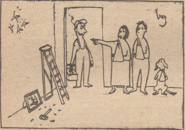
—No es más que poner un clavo para colgar el cuadro. ("Samedi Soir")