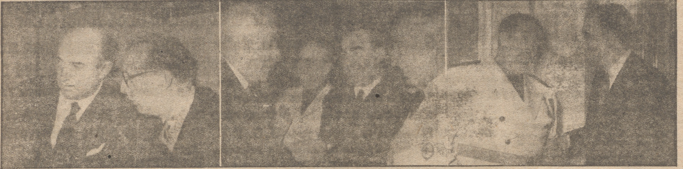
Los pasillos de las Cortes Españolas ofrecen su tradicional animación cuando hay reunión del Pleno. De ordinario, el trabajo laborioso de las Ponencias no se refleja al público, precisamente porque es continuado, minucioso y eficaz. Pero llega el día del Pleno, los procuradores todos se reúnen para juzgar la gigantesca tarea de las Comisiones, deliberar y decidir sobre su aprobación. Y entonces el Palacio de las Cortes recupera su ajetreo característico. Y los pasillos encauzan la corriente de conversaciones, intervenciones, consultas, impresiones... El redactor gráfico ha sabido captar momentos interesantes. El ministro de Información y Turismo, señor Arias Saigado, cruza impresiones con el ministro de Comercio, señor Arburúa, en el escaño del Gobierno. El ministro subsecretario de la Presidencia, señor Carrero Blanco; el ministro de Industria, señor Planell; el ministro secretario general del Movimiento, señor Fernández-Cuesta, y el ex ministro de Obras Públicas señor Fernández Ladreda conversan en una de las salas de juntas. El ministro de Educación Nacional, señor Ruiz-Giménez, y el de Trabajo, señor Girón, se saludan a la llegada.

Juraron su cargo los nuevos procuradores, y el presidente pronunció un importante discurso