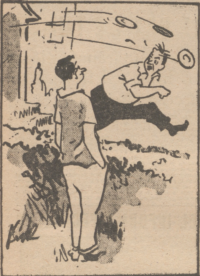
—Vo, hace mas de quince años que veo los platillos volantes. ("Samedi Soir")