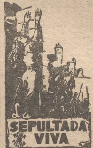
Desafió las leyes divinas y ni los lazos de sangre le detuvieron en su ambiciosa y criminal carrera

Hoy, jueves, se celebra la décimotercera reunión del V Ciclo de Sesiones Cinematográficas, con carácter extraordinario y a beneficio de la Asociación de Antiguos Alumnos del Instituto Ramiro de Maeztu, a las seis y media de la tarde, en el teatro del Instituto.