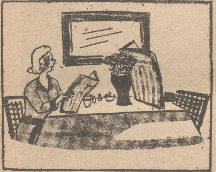
—Date prisa. Llegarás tarde a la oficina. (Samedi Soir.)