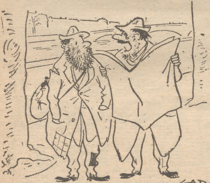
—He aquí una noticia de interés: la baja de los artículos textiles.