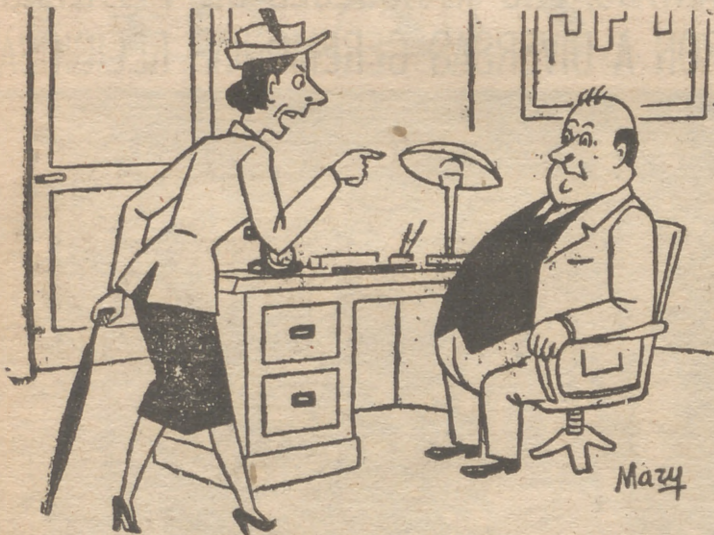
—Y espero no verte nunca a la secretaria encima de las pómilas.