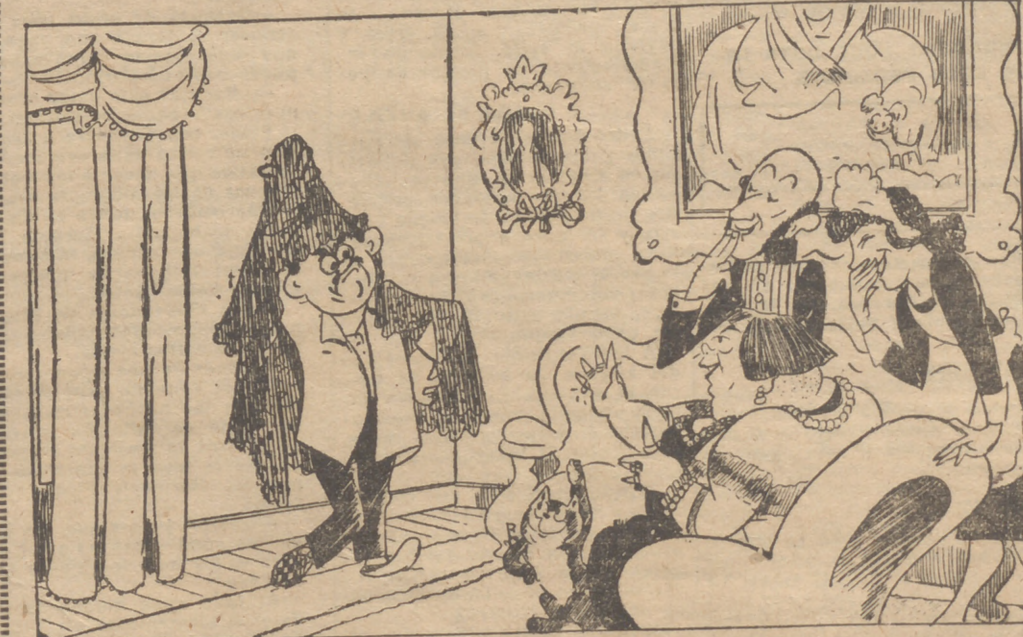
—Pues sí, Celedonio. Me pondré esa mantilla porque todavía cae bien...