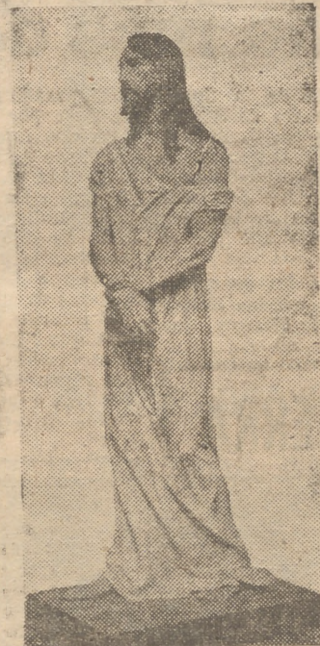
Imagen del Divino Cautivo, obra de Benlure, que figura en las procesiones madrileñas de hoy, Jueves Santo, y en la del Silencio.

JESUS.—Tú lo has dicho, y aun os digo que veréis después al Hijo del Hombre sentado a la diestra de Dios y viniendo sobre las nubes del cielo.