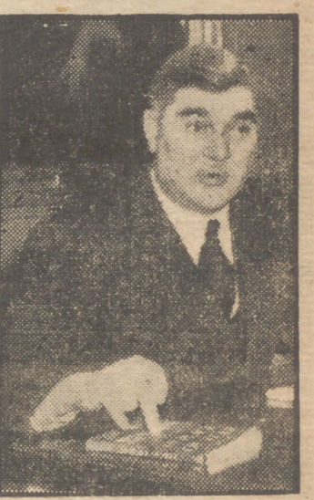
El laborista rebelde Aneurin Bevan señala su libro "In Place of Fear" durante una reciente conferencia de Prensa celebrada en Londres con motivo de la publicación del mismo.