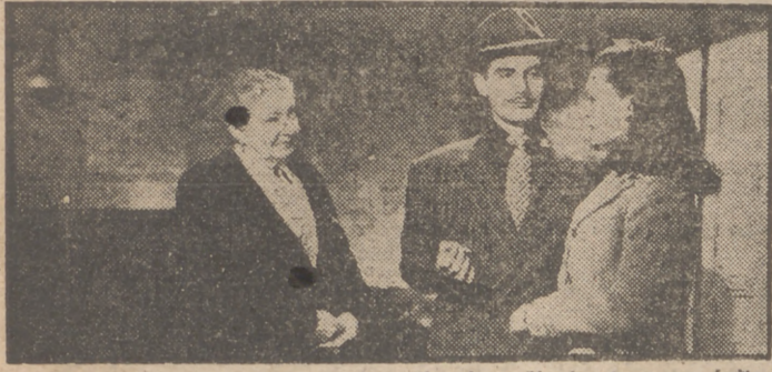
He aquí una escena de la extraordinaria película de gran éxito "Muchachas en libertad", que la prestigiosa distribuidora Coa presenta hoy, lunes, en el Palacio de la Música.