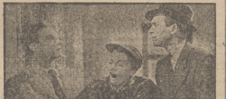
He aquí a los tres principales intérpretes de "Viva la vida". De derecha a izquierda: James Stewart y Joan Fontaine, protagonistas del film, y Eddie Albert, más simpático y guasón que nunca en este nuevo éxito cómicodramático de Universal-International.

El estreno de "Muchachas en libertad"—un título prometedor como ninguno—se ha fijado para hoy lunes 13, en el Palacio de la Música, marco siempre de todos los grandes acontecimientos del cine mundial. Y será distribuido por C. E. A. Distribución.