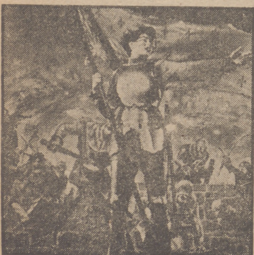
Ingrid Bergman, la exquisita actriz sueca, intérprete de los films de mayor éxito, logra la mejor de sus creaciones en la grandiosa superproducción de la R. K. O. Radio "Juana de Arco", que con éxito ascendente sigue triunfando en las pantallas de los lujosos salones de los cines Paz y Calatravas.