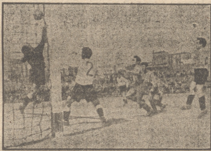
El gol que se anuló por fuera de juego (?) al Cuatro Caminos en la final de aficionados. (F. Velasco.)