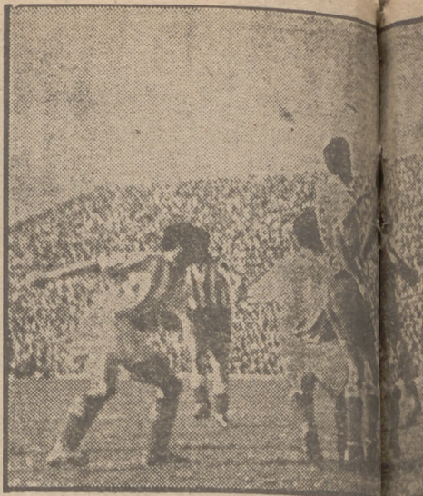
Un ataque en trampa del Atlético a la Real Sociedad, de puño, despejará la situación.

Dos a cero en la primera parte y cinco a tres en el resultado final. La Real llegó a empatar a dos y tres tantos. Juncosa fué la figura destacada PERO el EQUIPO GUIPUZCOANO NO JUGO SU CLASICA FORMULA