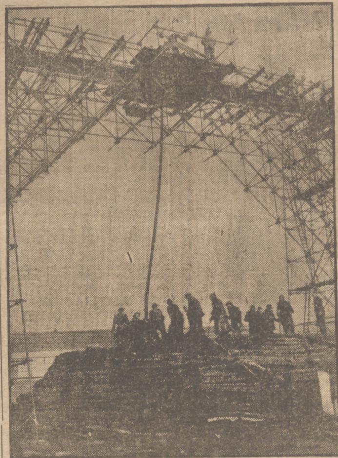
Los aliados llamaron "Pluto" a la manguera tendida bajo el mar entre Inglaterra y Francia por la que se suministró la gasolina a los vehículos de motor que intervinieron en la invasión del Continente. Ahora se procede a recoger el vital instrumento de la victoria aliada. El nombre de "Pluto" se deriva de las iniciales de "Pipe Line under the Ocean".