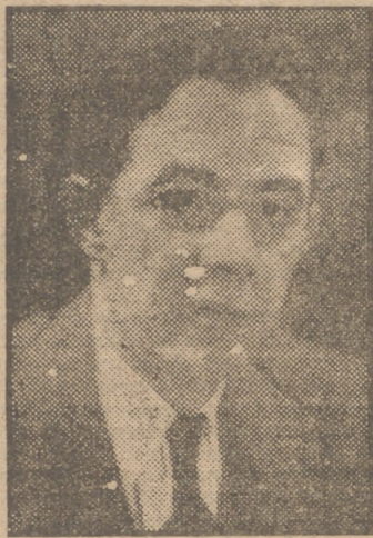
El doctor Alfred Blalock, cirujano jefe, que llevó a cabo la primera operación en un niño "azul" en 1944. Antes había experimentado su técnica en animales.

El corredor principal de la clínica para niños enfermos del corazón en un hospital de Baltimore es bajo, estrecho y poco luminoso. Allí se congregan niños enfermos y madres y padres en ansiosa vigilancia junto a las sillas y los bancos adosados a los viejos muros. Hasta hace un año ese pasillo era considerado como la antecámara de las desesperanzas y las angustias de los corazones paternos. Era como un túnel tenebroso, en donde se perdía para siempre la ilusión de salvar al hijo enfermo. Los niños traspasaban la blanca puerta del fondo del pasillo y volvían a salir con la implacable sentencia en los labios de una enfermera necanzada e indiferente a tanto dolor. La ciencia no ofrecía remedios ni esperanzas a los "niños azules". Hoy las cosas ocurren de muy distinta manera. El sombrío túnel es un pasillo radiante hacia tiempos mejores. Por fin, los niños serán salvados.