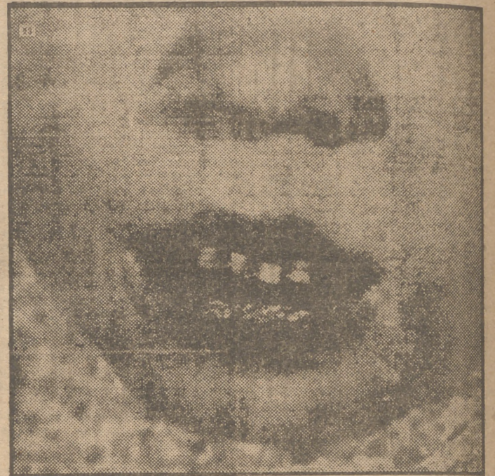
Antes los niños "azules" estaban condenados a perecer sin remedio. Hoy viven y bullen. Un nuevo método operatorio ha traído radiante esperanza a aquellos desgraciados, los que más sufrían entre todos los dolientes infantiles.

Volvamos a la arteria en forma de T. Desde el lado izquierdo del corazón fluye la principal arteria del cuerpo humano, la aorta, que lleva sangre roja. La aorta asciende por encima del corazón y de allí desciende