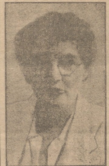
La doctora Helen B. Taussig, jefe de la clínica de niñas del hospital Johns Hopkins. Sus estudios de los defectos circulatorios la pusieron en la pista de las intervenciones quirúrgicas en esta terrible enfermedad.

—La vi seis semanas después de la operación—escribe el doctor—. Había cambiado por completo. Había perdido su anterior apatía; ya se interesaba por mí y por lo que yo hacía en su beneficio. La temperatura era