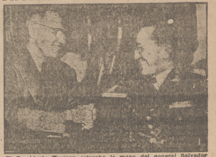
El Presidente Truman estrecha la mano del general Salvador César Obino, jefe del Ejército brasileño, en la Casa Blanca.