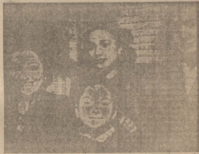
La lotera de la calle de Espoz y Mina, vendedora de una de las series del "gordo".