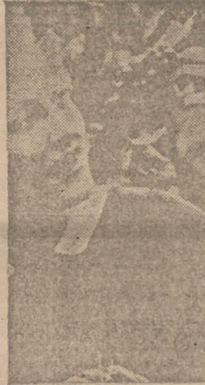
La amplia, franca sonrisa del forjador de la victoria aliada brilla en el rostro de Winston Churchill a su llegada a Metz, mientras sus dedos forman la "V" ya histórica.

Lord Nelson recibía una anualidad de 5.000 dólares. Hace algún tiempo el punto fué debatido en la Cámara de los Comunes, cuando se trató de compensaciones similares para los líderes contemporáneos ingleses. Pero se decidió finalmente no darle compensación, y la pensión de Nelson se suspenderá tan pronto fallexan los actuales beneficiarios, sus herederos.