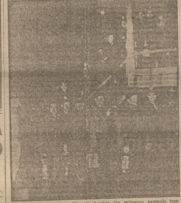
Después de diecisiete días de huelga los mineros yanquis han vuelto a su trabajo. Aquí un grupo de ellos en una mina de Richeyville (Pensilvania), esperando su turno para entrar en el montacargas.