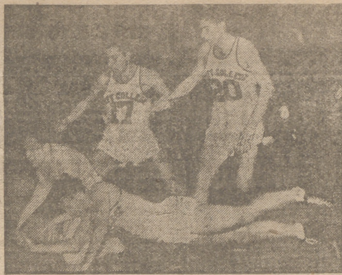
El deporte norteamericano, por su dureza, es totalmente distinto del europeo, aun en aquellas especialidades tenidas en nuestro Continente por suaves. He aquí—como demostración—esta escena de un partido de baloncesto entre dos equipos universitarios en el Madison Square Garden.