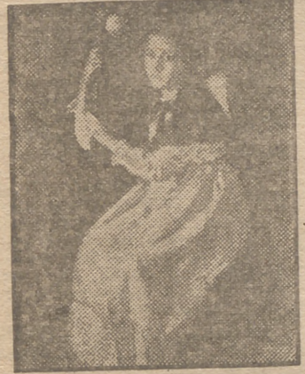
"Peregrina", original de F. Briones.

Los paisajes y los floreros que ahora exhibe responden en calidad, en técnica y en concepto a los éxitos, ya bien ganados con sus anteriores cuadros de figura. El lector ya conoce las causas que nos privan de poder ofrecer al público un mayor espacio en estas crónicas