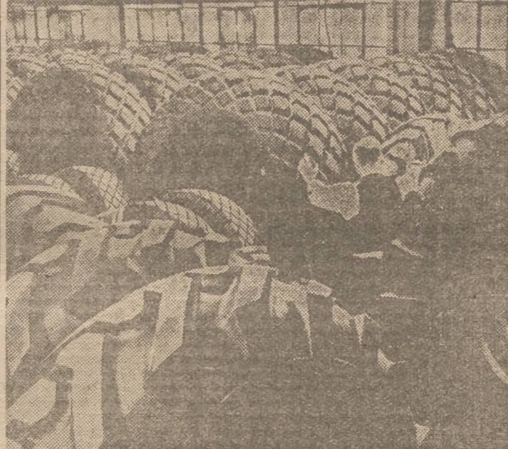
Una buena noticia para la industria del caucho es el restablecimiento del mercado de esta primera materia, que se persigue a toda prisa.

La situación se presenta así: Para 1947, la producción de caucho malayo será de 500.000 toneladas; 150.000 la de Indias Holandesas; la de Siam, Célán y Indochina llegará a las 250.000 toneladas. Es decir, un total de 900.000 toneladas de caucho natural contra una producción de 360.000, que vendrá a ser la de 1946, y 235.000 que fué la de 1945.