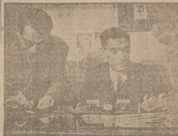
El director de "Cuponos York" que jugaba cuarenta pesetas en el "gordo".