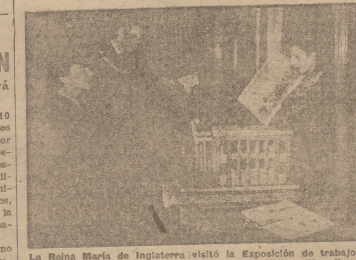
La Reina María de Inglaterra visitó la Exposición de trabajos de las alumnas del colegio de Bothwick. Entre ellos llamó su atención esta maqueta que reproduce la iglesia de San Martín. Con la reina contemplan la obra miss Ellen Wilkinson, ministro de Educación y uno de los profesores.