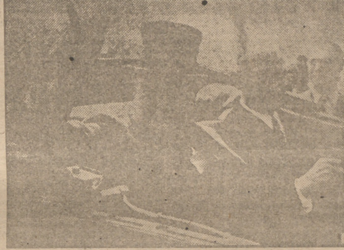
La amplia, franca sonrisa del forjador de la victoria aliada brilla en el rostro de Winston Churchill a su llegada a Metz, mientras sus dedos forman la "V" ya histórica.

NUEVA YORK. Diecinueve de Winston Churchill, primer ministro (North American Newspaper Alliance) durante la guerra, se verá indirectamente re-