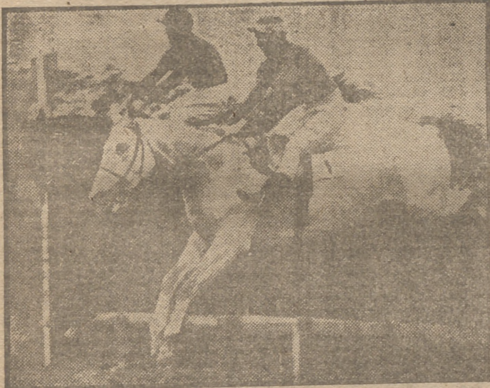
Los caballos "Kittaglorry" y "Schubert" en un salto de este durante la "steeplechase" de Withington. "Kittaglorry" se impuso a su rival directo cerca ya de la meta.