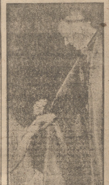
El cardenal Griffin, arzobispo católico de Westminster, visitó los Estudios de Pinewood, donde se está filmando la película "El capitán Boycott". La artista irlandesa Kathleen Ryan, estrella de la película con Stuart Granger, besó reverente el anillo del gran prelado inglés.