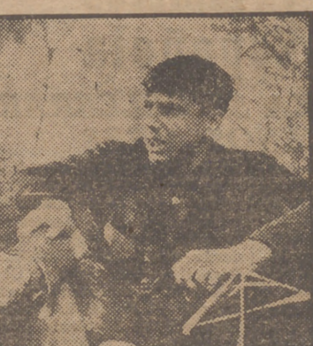
Johny Hoy y Ray Reagan en una escena de "La última oportunidad", film elogiadísimo por toda la crítica del mundo y que en breve será presentado a nuestro público por Edici.

Bellas aventuras en la época de nuestra Reconquista. Tolerada menores.