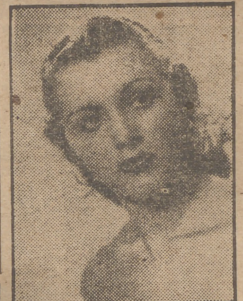
Paquita Rico, bellísima estrella del espectáculo "Triana", que mañana, viernes, se presenta en el teatro Reina Victoria.