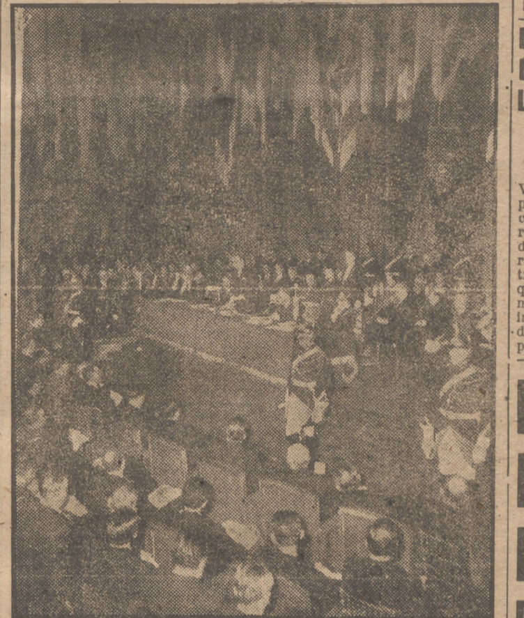
Georges Bidault, presidente provisional de Francia, presidió la sesión inaugural de la U. N. E. S. C. O. en el anfiteatro de la Sorbona. El acto fué montado con todo esplendor. En la mesa presidencial se ve a Bidault, en pie, pronunciando su discurso.