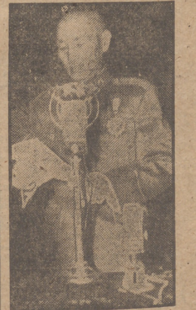
El generalísimo Chan-Kai-Chek, presidente de la República china, pronunció un discurso en el Parlamento de Nankín el día 18 de noviembre, día de la apertura de la nueva etapa parlamentaria.