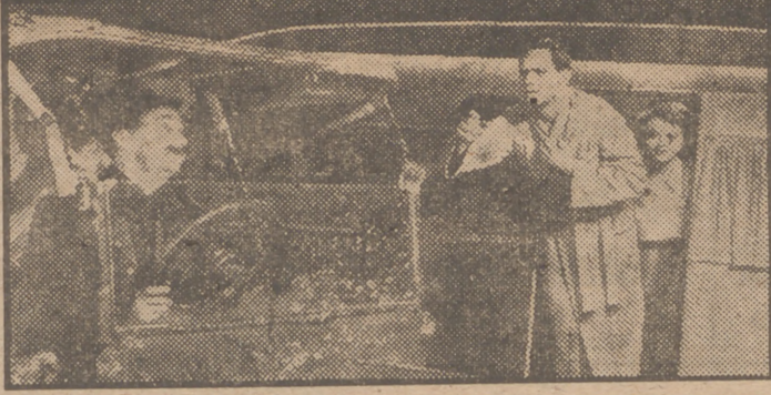
He aquí a Janet Gaynor y Fredric March en una escena del divertido film en tecnicolor "Ha nacido una estrella", que en breve será presentado por Cifesa.

CORTE ESTE CUPÓN y envíelo relleno con toda claridad a la Dirección del cine donde fué estrenada la película por la que vota. Esta película ha de ser necesariamente de las estrenadas en Madrid desde el 20 de octubre último al 30 de noviembre inclusive. Entre los votantes de la película que reúna mayor número de votos serán sorteados diversos regalos, entre los que figuran MIL PESETAS para invertir en GALERIAS PRECIADOS y QUINIENTAS PESETAS para adquirir artículos en tan importantes establecimientos.