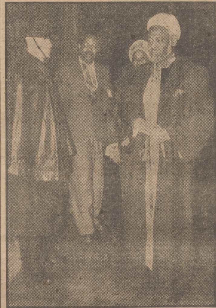
Abdel Rahman el Mahdi Bajá, el líder del Sudán, llegó, procedente de Kartoum, a Londres para la inmediata terminación del acuerdo de condominio angloegipcio sobre el terreno sudanés. El Mahdi Bajá visitó en Downing Street, 10, a Mr. Attlee, y en la puerta fué obtenida esta gráfica.