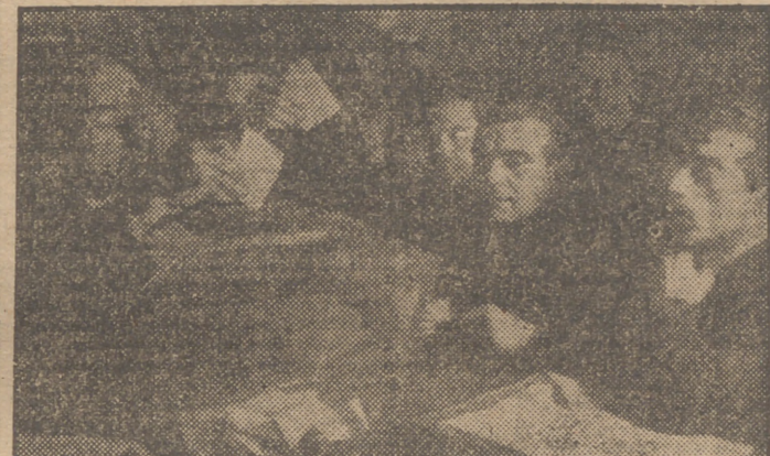
Un momento de la votación para elegir varios cargos del Congreso.