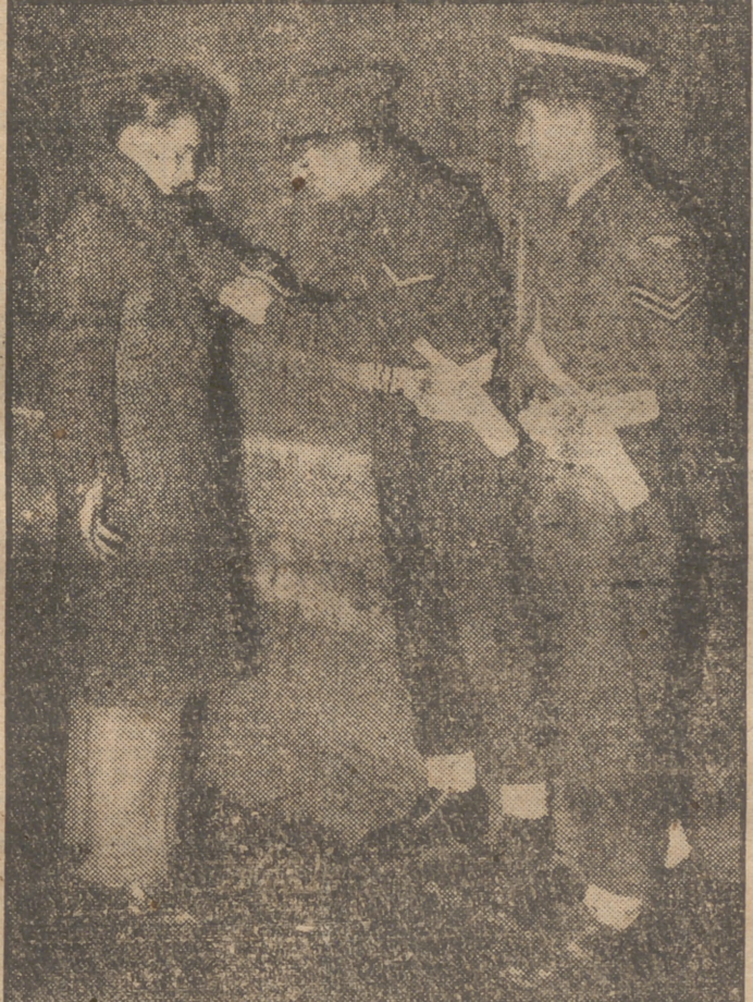
Después del atentado contra la Embajada británica en Roma, la vigilancia alrededor de la parisiense se ha reforzado. Los viandantes que pasan por la acera del Faubourg Honoré son registrados por la Policía inglesa que guarda el edificio.