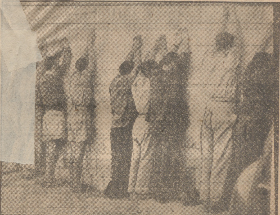
Alineados contra un muro, los brazos en alto, esperan estos judíos sospechosos la investigación de la Policía inglesa sobre los últimos atentados terroristas en Palestina y especialmente del perpetrado contra la estación del ferrocarril que ocasionó muertos y heridos en el servicio de vigilancia.