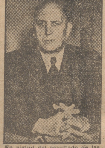
En virtud del resultado de las elecciones municipales que dió el 43 por 100 de los votos al partido socialdemócrata, llega a la Alcaldía de Berlín el doctor Otto Ostrowski.