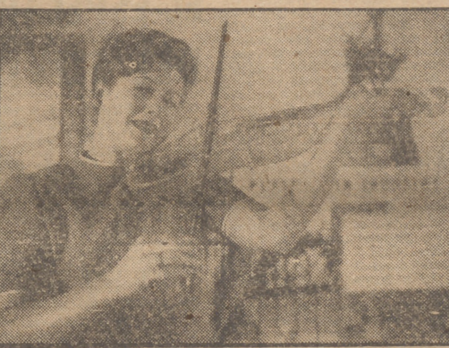
En la Exposición de trabajos sobre material plástico que está abierta en Londres figura este violín, con su correspondiente arco, cuya transparencia es asombrosa.