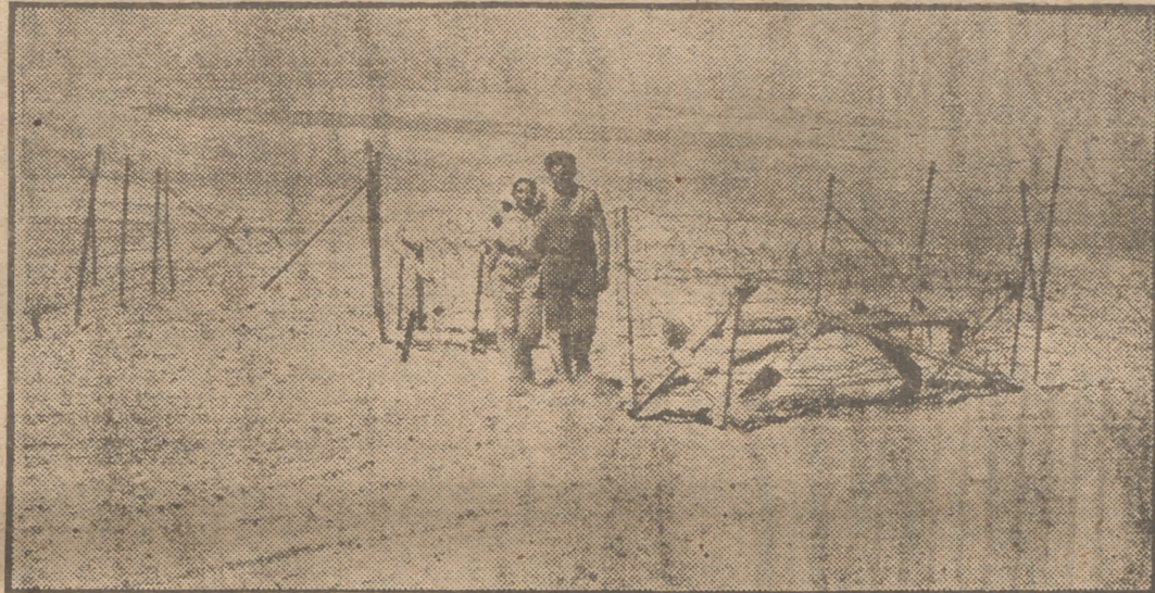
Una joven pareja judía, inmigrantes ilegales en la tierra prometida, entra en el recinto de un campo de concentración, protegido por espino artificial contra las bestias salvajes. Ellos esperan que llegue una de las casas prefabricadas como las que los primeros inmigrantes consiguieron introducir en Palestina.