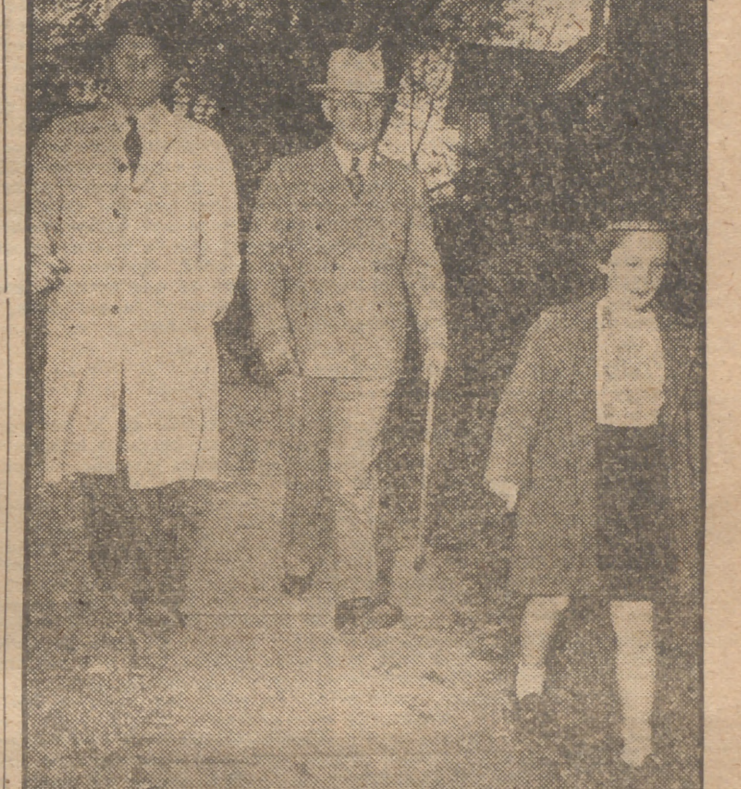
Mr. Truman, acompañado por un miembro de la Policía secreta presidencial, pasea por una calle de Independence (Missouri). La derrota demócrata en las elecciones ha hecho brotar voces que reclaman la dimisión de Truman antes de expirar el plazo legal de su mando.