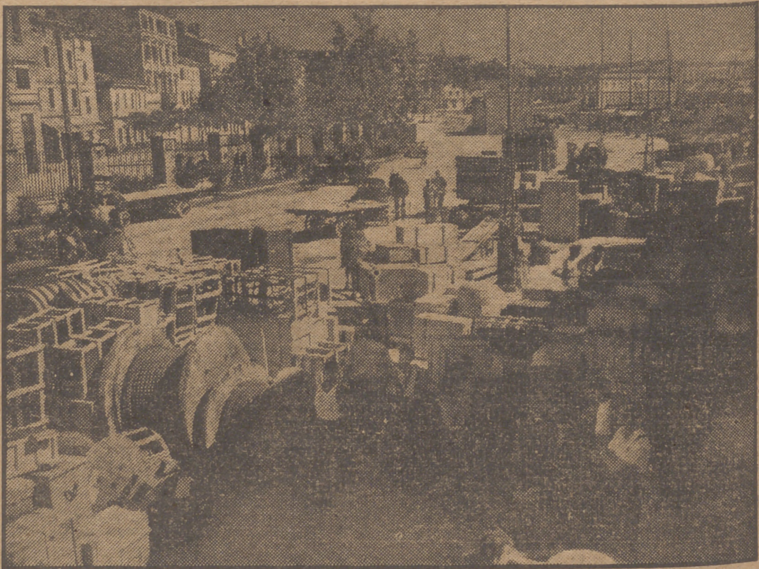
Para no vivir sometidos al dominio yugoslavo, los súbditos italianos abandonan la Venecia Julia. Toda clase de medios de transporte son utilizados. He aquí el puerto de Pola, en Istria, repleto de menaje de italianos en espera de ser embarcados con rumbo a Venecia, Trieste y otros puertos.