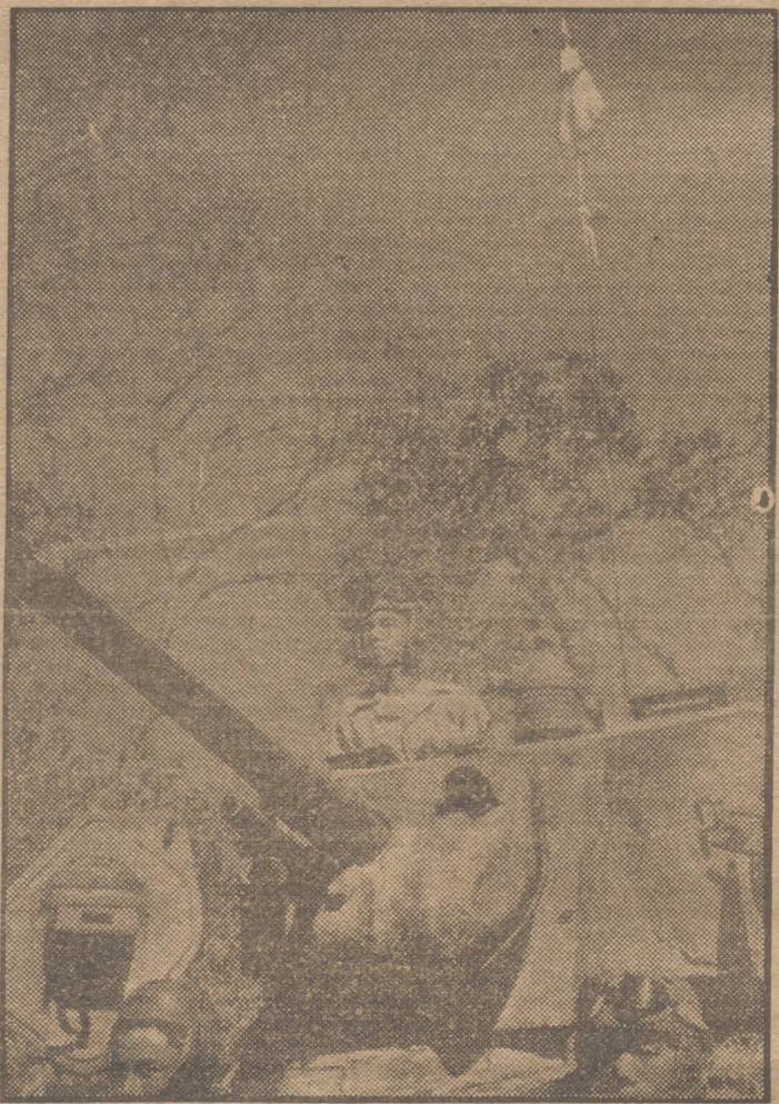
Un tanque norteamericano recorre la carretera de Ledo antes de abrirse ésta al tráfico.

El mismo día 7 de julio, el Comité Central Comunista hizo unas declaraciones desde Yenán, en las que sus cuarenta miembros especificaban las demandas sobre Nankín. Lo que los jefes militares comunistas pedían al Gobierno de Nankín era: reclutamiento, movimientos de tropas y obras de defensa, devolución a los Estados Unidos de todo el material recibido en concepto de préstamo y arriendo, abandono del proyecto del asesoramiento militar norteamericano, que aconseja la instrucción de las tropas comunistas y nacionalistas en un Ejército chino unificado, terminación del Acuerdo de Préstamos y Arriendos y retirada de la China del personal militar de los Estados Unidos. En cuanto a lo político, los dirigentes comu-