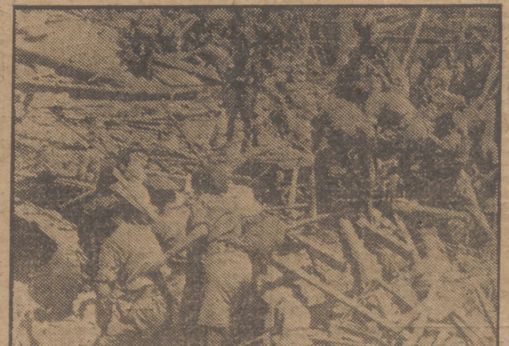
Rápidamente se iniciaron los trabajos de salvamento. Soldados ingleses procuran abrirse camino para llegar a los sitios en que los heridos esperan el socorro que reclaman con gritos desgarradores. (Lea la crónica de Londres en página 3.)