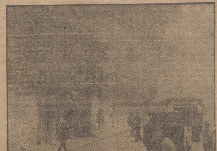
La cámara fotográfica recogió el momento de hacer explosión la bomba colocada en los sótanos del hotel Rey David, de Jerusalén. Los viandantes huyen despavoridos buscando refugio. Una nube de humo y de polvo oculta la vista del hotel.