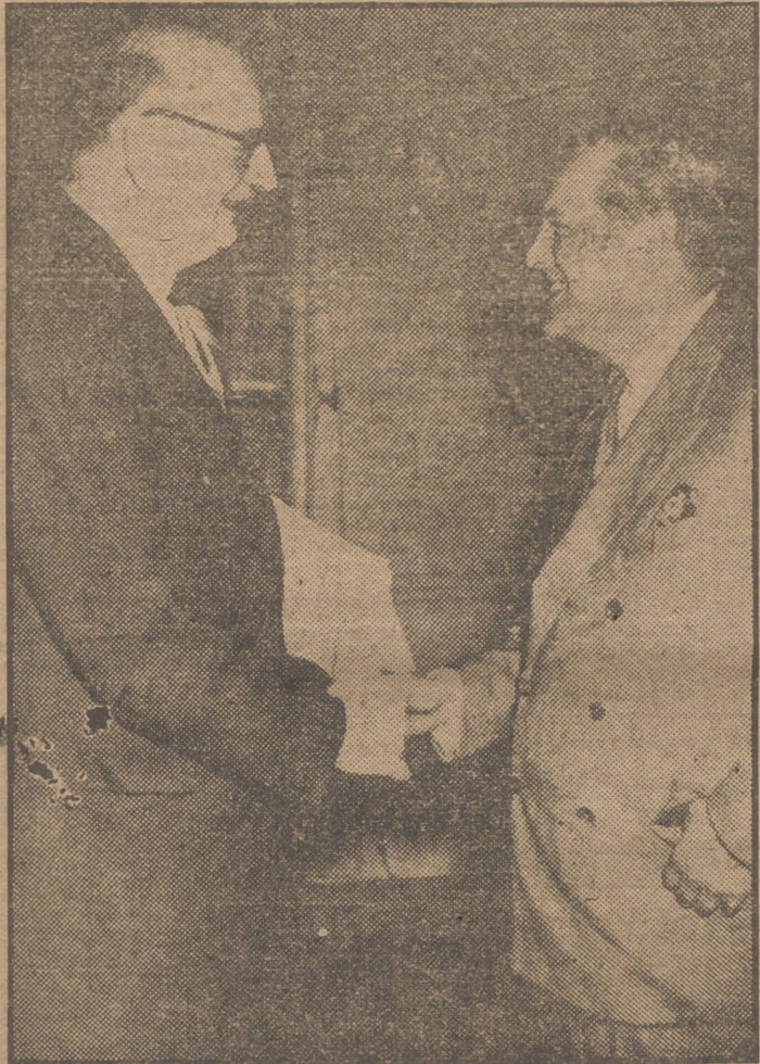
Randolph Churchill, hijo del ex premier inglés, declaró como testigo de la defensa en el juicio seguido contra René Etienne Flandin. La declaración del periodista inglés influyó no poco en la levedad de la pena impuesta al ex presidente francés, a quien se ve en la foto (izquierda) estrechando la mano de Randolph.