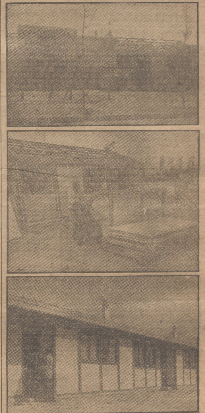
En la barriada de la Plaza de Toros de las Ventas han comenzado a ser instaladas—a título de ensayo—las casas prefabricadas, compuestas de tres habitaciones, cuarto de aseo y cocina. Caso de dar resultado, el número de estas viviendas se aumentará para enjugar, provisionalmente, y en parte, el problema de las viviendas modestas.