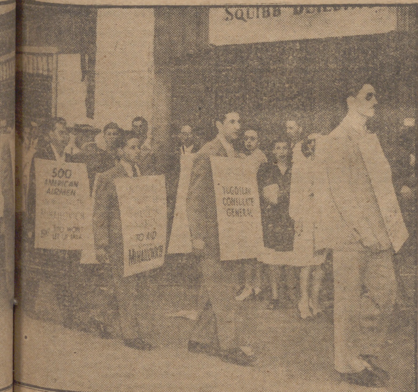
Los aliados que combatieron al servicio de los checniks de Mihailovich se abrieron las puertas del Consulado de Yugoslavia en Nueva York en defensa del yugoslavo. Su gesto no tuvo influencia alguna y su viejo compañero de arma murió fusilado.