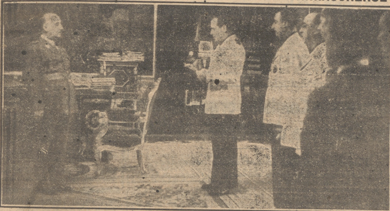
El Jefe del Estado recibe en el Palacio del Pardo al alcalde de Tarragona y una Comisión de dicha ciudad, que le entregó la Medalla de Oro de ex combatiente tarraconense.