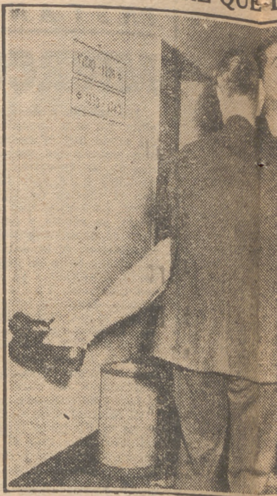
Después de tres horas de anhelante espera a su ídolo, Van Johnson, y recibió entonces desfallecida. La fotografía reproduce el momento en que Mayday Ann es abrazada por los circunstanciales brazos del hombre idolatrado los que ella había soñado para su débil cor-

información publicada en la Prensa relativa a que el Gobierno británico había decidido enviar a la zona británica de ocupación en Alemania a 15.000 refugiados alemanes que se encuentran actualmente en el Reino Unido. (Efe.)