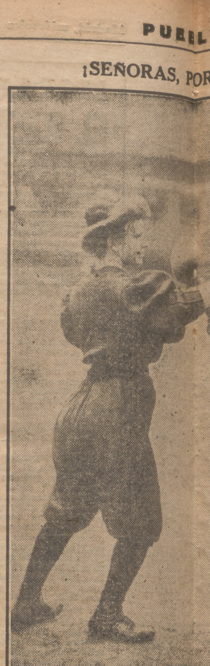
Cualquiera diría que estas dos damas, at van a d scutir unas cuentecillas pendientes nosotros. Pero no es así. La cosa es más trata de explicar a la dama de la derecha "atomizante". Son dos deportistas del och trenamiento con guantes de ocho onzas, el tranvía de la calle de Narváez? Qui atrozmente impenetrab

propios delincuentes de guerra. Una organización oficial japonesa había empezado ya a obtener datos y pruebas para los juicios que se proponía celebrar. (Efe.)