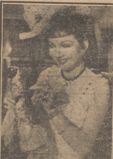
Claudette Colbert, nunca más bella ni más interesante como en "Zazá", película basada en la novela de gran éxito del mismo título, una superproducción de la Paramount que Cifesa presentará muy pronto en el cine Avenida.