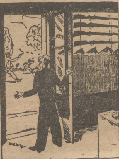
EL ARMERO (viendo a un gangster). —¡Oh, qué magnífico cliente!

En la tumba egipcia de Psousenneh acababan de ser encontrados objetos de oro de un valor inestimable. El hallazgo puede ser equiparado al que se descubrió en la tumba de Tutankamen. Ahora veremos si Psousenneh toma venganza, como Tutankamen, de todos los que iban a perturbar su reposo. Se recordará que sabio que penetraba en su tumba se momificaba.