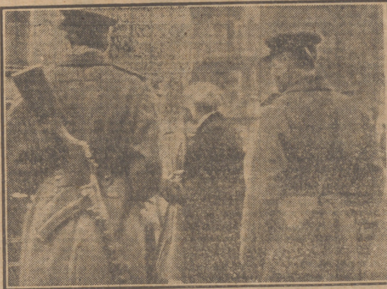
Soldados rusos, bien armados, buscan, en la zona de ocupación norteamericana, a los prófugos del Ejército soviético. Para cazar a sus "piezas" los tiradores rusos se apostan a las salidas de cines y teatros.