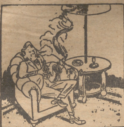
EL MUSICO QUE TOCA EL SAXO. FON HA PERDIDO LA PIPA.