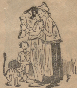
Leyendo SORPRESAS CHICAGO,