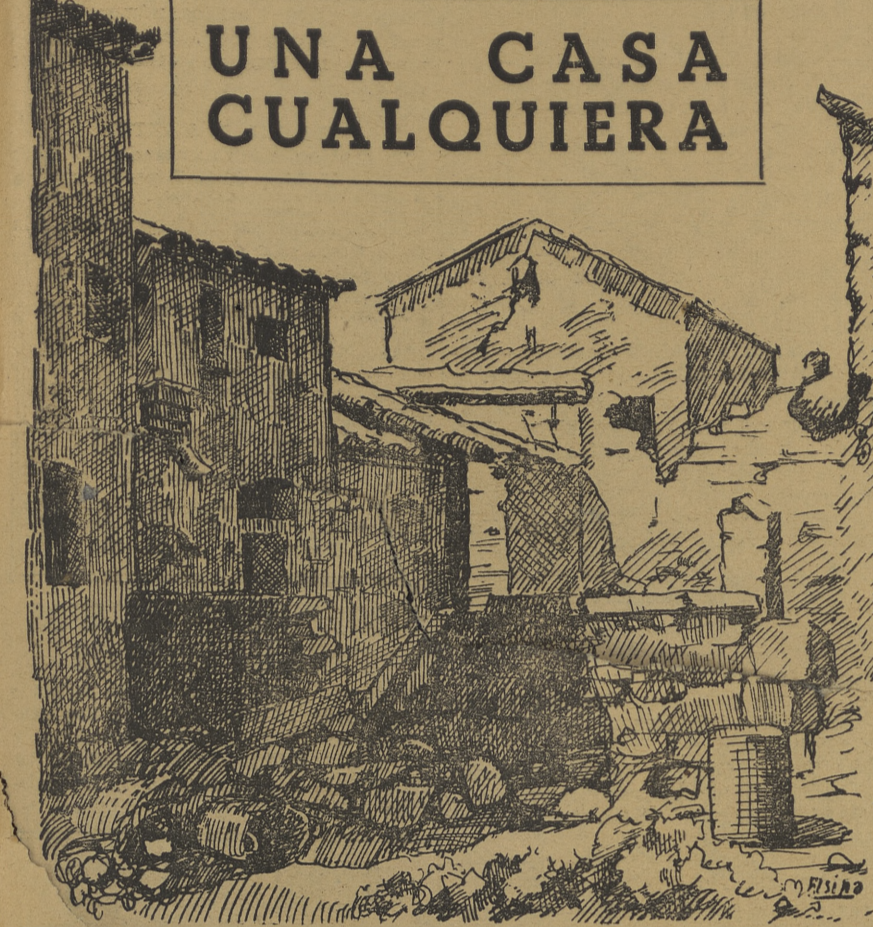
UNA CASA CUALQUIERA DE Sietamo sirve para albergar la redacción y la imprenta de "Alerta".

UN CAMARADA QUE HA VIVIDO EN ZARAGOZA BAJO LA DOMINACION DEL SANGUINARIO CARABALLAS, NOS ENVIA UNAS CUARTILLAS PONIEDO DE RELIEVE LA HIPOCRESIA CAPITALISTA QUE PIDE CLEMENCIA PARA DOS AVIADORES ALEMANES QUE HAN VENIDO A ESPAÑA A ASESINAR LA POBLACION CIVIL, MIENTRAS DEJAN PASAR SIN INMUTARSE LOS HORRIBLES CRIMENES DEL FASCISMO.