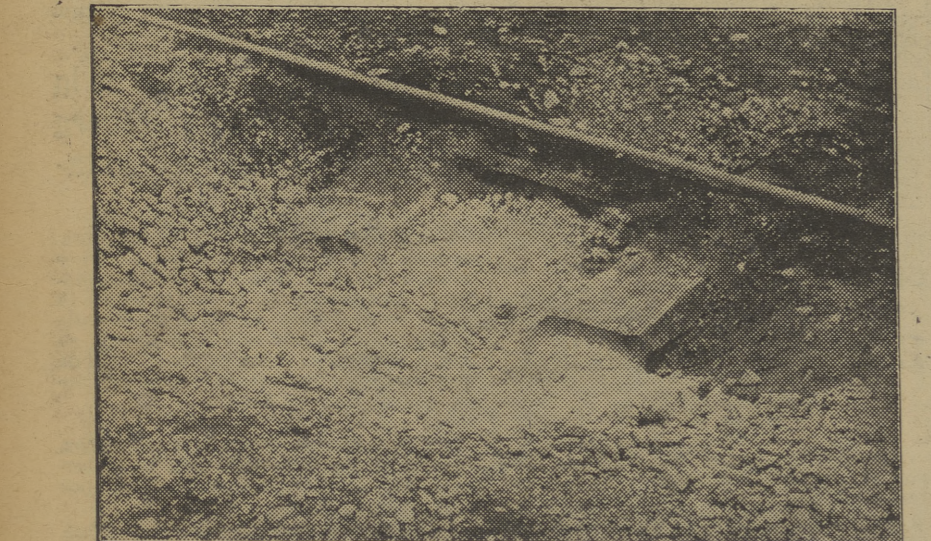
Cerca de la estación del Morrot cayó un proyectil, sin que, como se ve en la foto, lograra causar desperfectos en la vía férrea.

Un barco fascista quiere alarmar Barcelona, sin éxito alguno