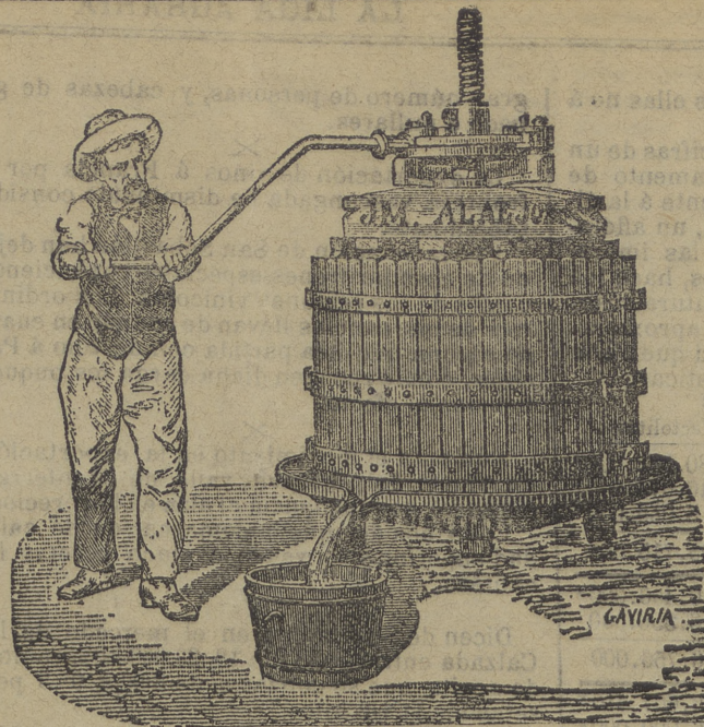
PRENSA PARA UVA