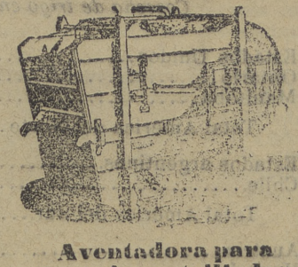
Aventadora para las mieses trilladas

JORGE MARTÍN É HIJOS, CONSTRUCTORES DE MÁQUINAS ALAEJOS—(Valladolid)