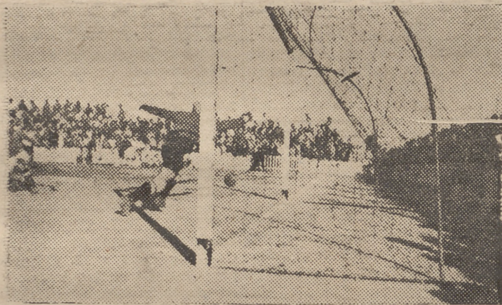
Uno de los "goals" conseguidos en el magnífico encuentro. El guardameta Laríos no puede detener el fuerte y colocado "chut" de Calderón, notable delantero centro malagueño.