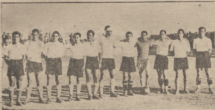
El equipo malagueño, que tras una brillantísima actuación, derrotó por un tanteo aplastante al Jerez.