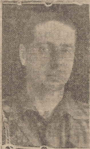
de su destino, Dios le dió el martirio.

Todas las juventudes de España, en este Madrid que el redimido amoldan homenaje al CAUDILLO entregándole solemnemente tierra de los campos de las más ruidosas batallas, de las batallas que engendrarán nuevas victorias y glorias de nuestros ejércitos. Del Llano Amarillo, Brimón, Ampeloma, Sevilla; tierra con un raudal de sangre; tierra que nos recuerda que por Dios, por España y su Revolución Nacional-Sindicalista cayeron muchos miles de españoles; tierra que es nuestra gran penitencia, porque nos abrumará si no cumplimos la voluntad certera de aquellos cuya sangre sorbió tierra del país trágico de la Cárcel de Alicante, que moldeó el cuerpo enorme de José Antonio, muerto a los treinta y tres años por aquellos a quienes quería redimir de sus errores. Para la eternidad