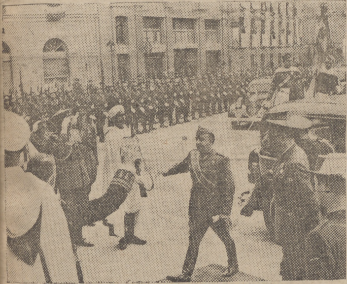
EL CAUDILLO LLEGA AL PALACIO DE LA DIVISION, EN BURGOS PARA ASISTIR A LA PRESENTACION DE CREDENCIALES DEL NUEVO EMBAJADOR DE ITALIA EN ESPAÑA, GENERAL GAMBARA.