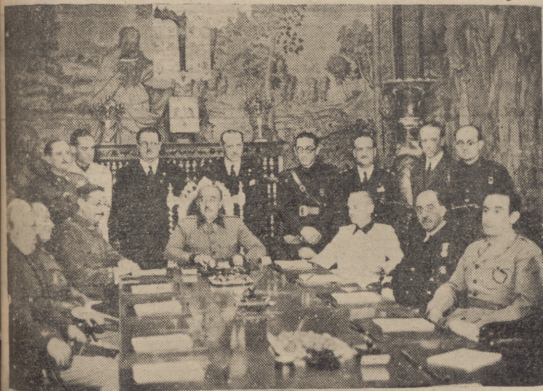
EL CAUDILLO Y LOS MINISTROS QUE COMPONEN EL NUEVO GOBIERNO DURANTE SU PRIMERA REUNION