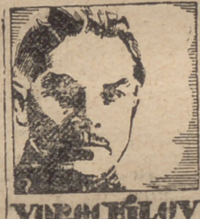
Comisario de Guerra soviético.

ROMA 5.—En los medios de esta capital se comenta la grave situación financiera de la URSS, basándose en el empréstito lanzado en Moscú. Además, esto se confirma por una noticia aparecida hoy en "L'Action Fran-