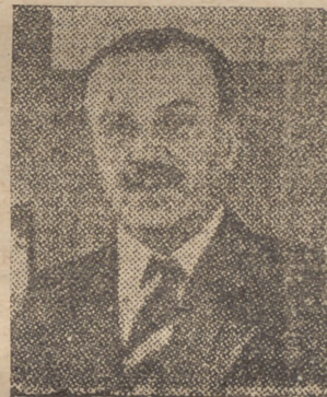
Molotov, comisario de Relaciones Exteriores de los Soviets.

causa" de París, según la cual el Gobierno de Moscú tiene la intención de poner nuevas condiciones para la firma de acuerdo tripartita, condiciones que se resumen en la autorización para emitir empréstitos sobre el mercado francés de fianzas.