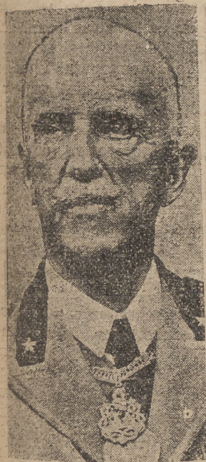
EL REY EMPERADOR REVISTA A LOS OFICIALES DE INFANTERIA

El Rey Emperador pasa revista en Roma, a trescientos oficiales de Infantería