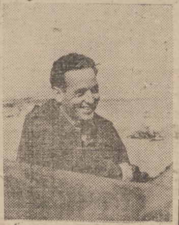
El Ayuntamiento sevillano ha tenido el noble gusto para perpetuar la memoria del infortunado "as" de la aviación militar española; de rotular con su glorioso nombre, la Avnida de Tablada