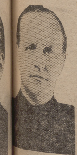
Sr. Ministro de Agricultura y secretario general del Movimiento