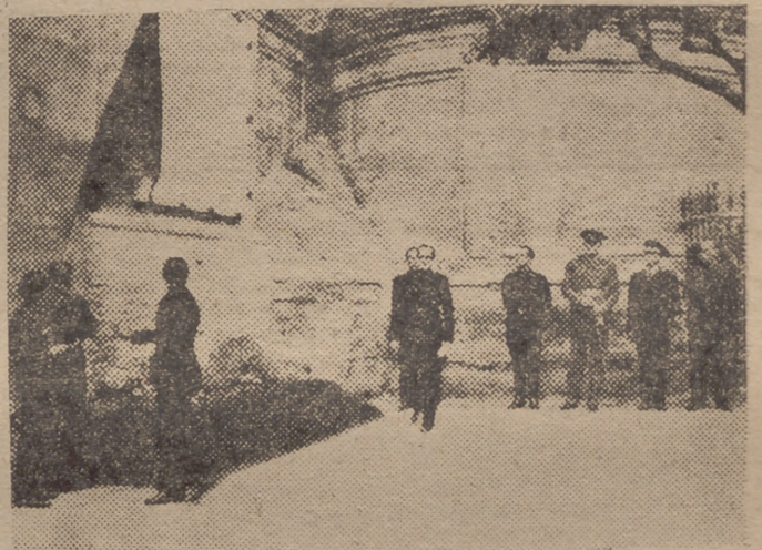
Momento de descubrirse la lápida en memoria de José Antonio.