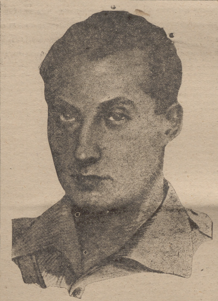
José Antonio Primo de Rivera ¡Presente!

...a sus elegidos, culminando en el momento decisivo el tránsito a la otra vida. No exista en lengua castellana una palabra que con justísima exactitud exprese la virtud que a un límite de secretismo se superó, pues esta virtud resplandece en la muerte de José Antonio, al haber trascendido los instantes de precisión matemática, vió la muerte en actitud de