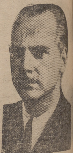
Excmo. Sr. Ministro del Interior, Prensa y Propaganda

Y, sin embargo, a poco que recapacite sobre su densa obra, la mu