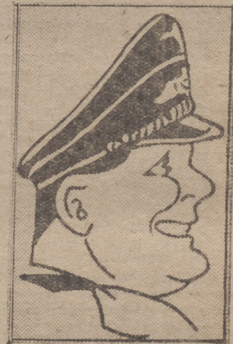
El mariscal Goring, que ayer pronunció en el Congreso de Nuremberg un sensacional discurso.

(Amplia información en las páginas centrales)