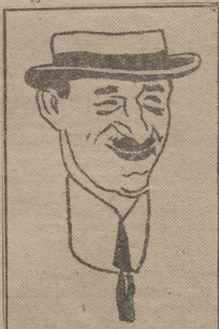
El presidente Benes, que ayer pronunció su anunciado discurso sobre el problema de las minorías en Checoslovaquia.

BOINAS ROJAS saluda brío en alto al camarada Sancho Dávila, ofreciéndole una vez más la certeza de nuestra patriótica adhesión para todo cuanto pueda traducirse en beneficio de la causa que defendemos.