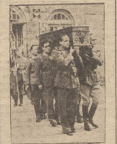
El féretro, a hombros de oficiales, es transportado a la carroza fúnebre

Con el general Queipo de Llano formaban la presidencia oficial el Excmo. Sr. Gobernador Militar de Málaga, general don Plácido Geta; el Excmo. Señor Gobernador Civil, don Francisco García Alted; Alcalde, don En-