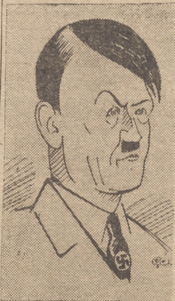
El Canciller-Führer, Adolfo Hitler, la figura cumbre del momento internacional