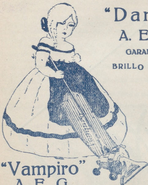
"Vampiro" A. E. G. LIMPIA TODO SIN TRABAJO ALGUNO