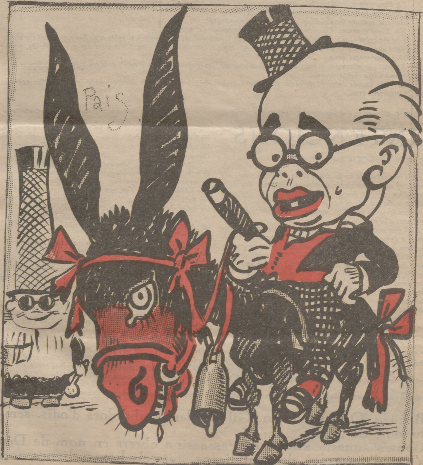
DESPRÉS DE LA DIADA